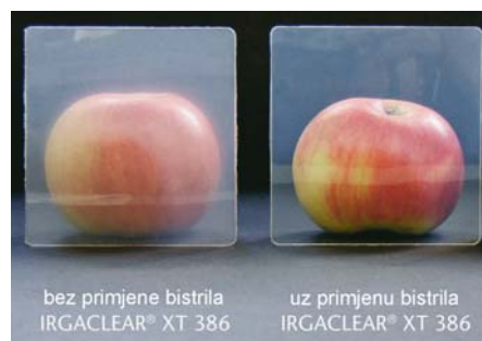
SLIKA 10. Primjer polipropilenske folije s primjenom Irgaclear XT 386 bistrila i bez njega

Slika 10 prikazuje polipropilensku foliju s primjenom Irgaclear XT 386 bistrila i bez njega.