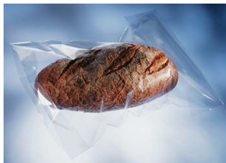
SLIKA 8. Kruh zapakiran u film načinjen od Borcleara RB709CF

RB709CF , namijenjena proizvodnji prozirnoga puhanog filma za pakiranje namirnica. Riječ je o statističkom kopolimeru polipropilena, od kojega se mogu izrađivati potpuno prozirni filmovi izvanrednih brtvenih svojstava, visoke krutosti i prikladnosti za tisak. Toplinska postojanost do 100 °C te niska razina heksana, tj. udovoljenje uvjetima koje postavlja američka Agencija za hranu i lijekove (FDA), učinile su taj materijal posebno zanimljivim za pakiratelje hrane. Posebno su zainteresirani pakiratelji kruha (slika 8), proizvođači višeslojnoga filma za pakiranje suhe tjestenine te proizvođači visokosjajnoga filma za etikete.