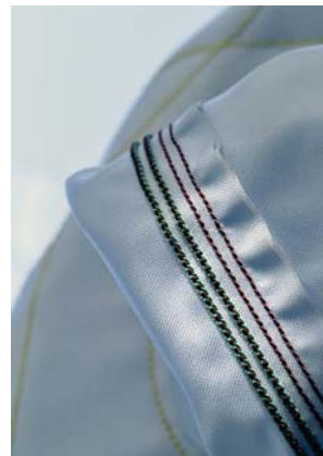
SLIKA 11. Primjer uporabe DSM-ova materijala Stanyl ® PA46

soke kristalnosti toga materijala, izvrsna mehanička svojstva te visoko talište. Uporaba toga materijala u proizvodnji vlakana i filmova omogućuje dobivanje široke palete materijala postojanih pri visokim temperaturama i postojanih na abrazijsko trošenje. Stanyl ® PA46 materijal je mehaničkih svojstava iznad svojstava klasičnih poliamida PA6 i PA66, uz istodobno nižu cijenu u usporedbi s egzotičnim konstrukcijskim materijalima kao što su PPS, PEEK, te aramidni i fluorirani polimeri. Preradba Stanyla u oblik vlakna ili folije zbiva se na standardnoj opremi pri malo povišenim temperaturama preradbe od one uobičajenih materijala. Stanyl ne umrežuje pri povišenim temperaturama, što olakšava njegovu preradbu. Dugotrajno izlaganje povišenim temperaturama u opremi za preradbu ne rezultira geliranjem materijala i potrebom za naknadnim čišćenjem (kao pri preradbi ostalih PA materijala). Viskoznost Stanyla snižuje se toplinskim starenjem , što dovodi do efekta samočišćenja. Primjena Stanyla u obliku vlakana i folija usmjerena je na vodopostojane proizvode, proizvode otporne na trošenje te izložene povišenim temperaturama. Uporaba Stanyl filmova u ostalim materijalima rezultira izvrsnom kemijskom barijerom. Najčešći korisnici toga materijala dolaze iz automobilske industrije, kemijske industrije, kozmetičke, tekstilne industrije, elektroničke industrije itd.