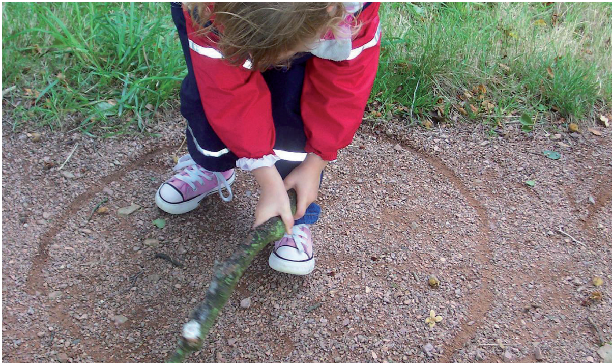
Dijete ne prihvaća svijet kao objektivnu stvarnost već sebe i cjelokupno okruženje konstruira u okvirima jedinstvenih mjerila svoje osobnosti

ma u kojima se obavlja praktični dio obrazovanja;