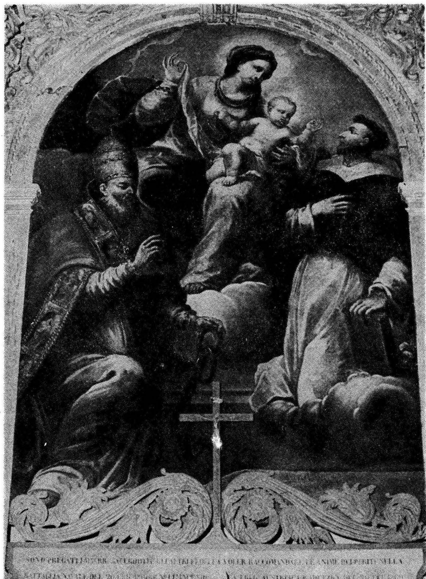
Pala Gospe od Ružarija sa sv. Dominikom u crkvi sv. Klementa