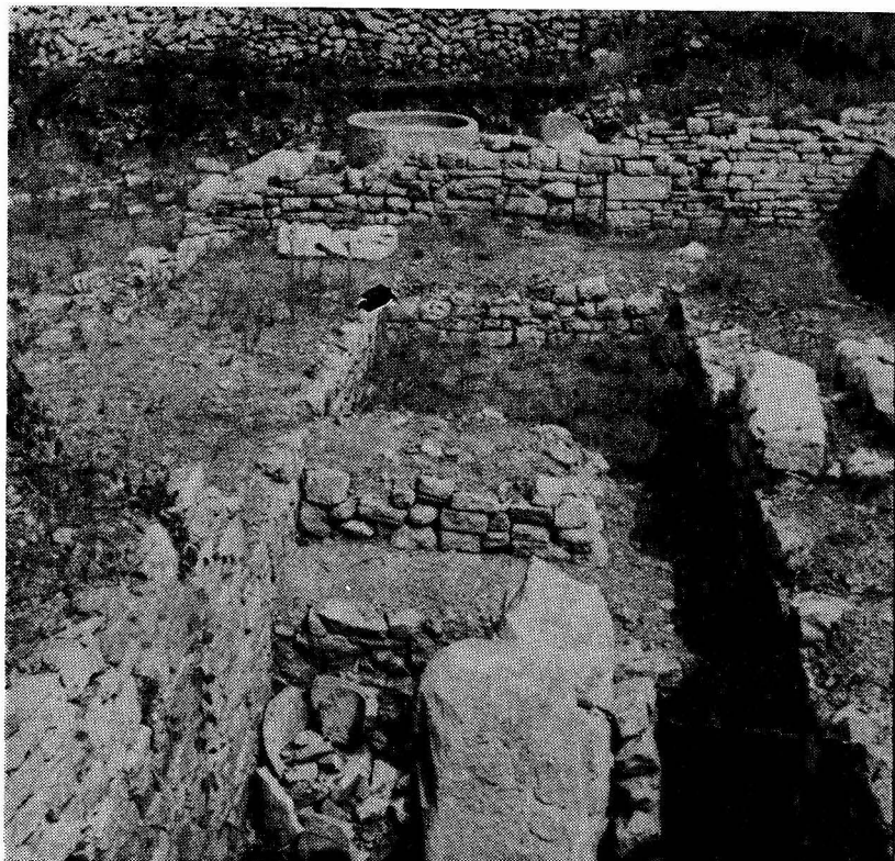
Pogled na južni i sjeverni tijesak na Kupinoviku

jela. U njenom sjeveroistočnom uglu, nešto iznad dna kamenice oko 4—5 cm, nalazi se mali okrugli otvor za otjecanje taloga ulja, koje se u ovim kamenicama vjerojatno bistrilo, te bi ove kamenice bile završni dio postupka prerade maslina. U prostoriji sjeverno od ove kamenice nalaze se dvije okrugle povišene nabijene podloge, koje su morale biti više, ali je obrada zemljišta i njih oljuštila gotovo do temelja. Vjerojatno su i one bile u funkciji prerade maslina, bilo uskladištenja ili odlaganja samljevene mase ili nešto slično.