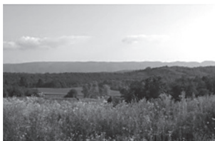
Pogled na Papuk