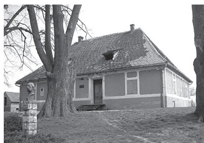
Rodna kuća Petra Preradovića

Putovanje Virovitičko-podravskom županijom završava u Pitomači koja je naziv dobila po pitomoj zemlji. Pitomača je najveće selo županije i jedno od najvećih u Hrvatskoj koje i danas njeguje podravsku tradiciju. Nedaleko od Pitomače, u malom selu Grabrovnica, rođen je veliki hrvatski pjesnik Petar Preradović.