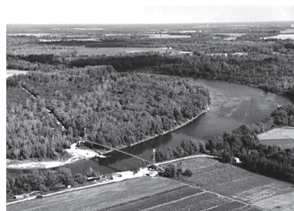
Drava pokraj Pitomače

ZADATAK. Rijeka Drava je zlatonosna rijeka te danas najvjerojatnije i jedina hrvatska rijeka u kojoj se može naći zlato u obliku gotovo nevidljivih listića do kojih se dolazi ispiranjem šljunka. Tim starim podravskim zanatom bavio se i djed Ivo. Svaki dan djed Ivo ispirao bi otprilike 3 \text{ m}^3 šljunka te bi u njemu našao 0,5 – 2 g zlata. Koliko je najviše zlata mogao „proizvesti” tijekom 10 godina ispiranja šljunka, a koliko nakon 35 godina? Pretpostavimo li da 1 \text{ m}^3 ima masu otprilike 2000 kg, koliki je otprilike postotak zlata u toj količini dravskog šljunka?