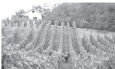
Vinogradi na Bilogori

ZADATAK. Dolaskom jeseni sazrijeva grožđe. Jedna od važnih zadaća vlasnika vinograda je berba. Obitelj Tudum odlučila je ove godine sama obrati svoj vinograd. Bere li otac grožđe sam, potrebno mu je 10 sati da završi posao. Majci je za isti posao potrebno 2 sata više. U pomoć će im doći i njihova dva sina kojima je za isti posao potrebno 15 sati ako rade zajedno.