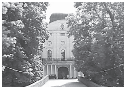
Pogled prema dvorcu

Značajan kulturno-povijesni spomenik Virovitice je Dvorac Pejačević . Dvorac se nalazi u samom središtu grada, a okružen je starim i rijetkim vrstama drveća.