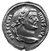
Kovani novac Rimskog Carstva

Tako izdane potvrde zapravo su preteča današnjih novčanica zamjenjivanih za novac od plemenitih metala. Malo-pomalo banke su izdavale više papira nego što je bilo njihovo pokriće u kovanom novcu. Ubrzo su ljudi shvatili da je ovakav način zamjene, ili ušteda zlata i srebra, dobra i za državu i za ljude.