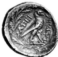
Grčki kovani novac