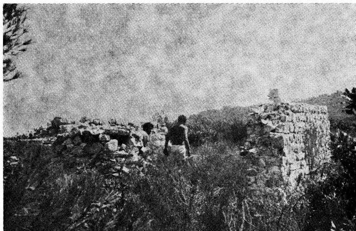
Sl. 1. Pogled na crkvicu sa zapada

Cijelo područje otoka zapadno od grada Hvara zove se Pelegrin, no ishodište tog toponima, tj. da je tako nazvan po crkvi Sv. Pelegrina skoro je nepoznato i današnjim Hvaranima. Ostaci crkvice i danas su vidljivi. Budući da nije uvedena u popis hvarskih spomenika 1 , a predstavlja značajan spomenički objekt, to ćemo je pokušati ovdje, bar u osnovnim crtama, predočiti. 2