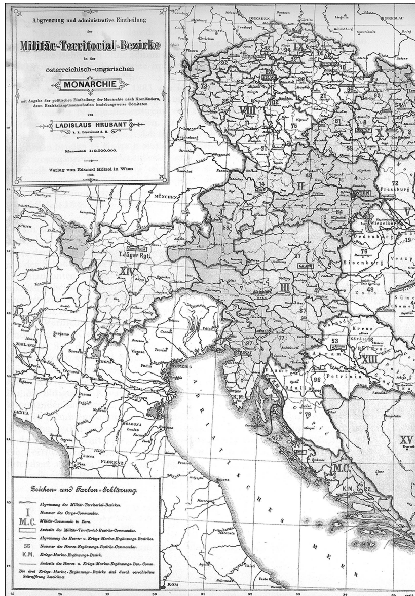
Sl. Ia. Podjela Austro-Ugarske Monarhije na vojno-teritorijalna područja 1883. godine Die Habsburgermonarchie 1848–1918, Karte 2.