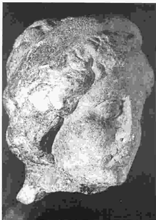
Sl. 4. Ulpijana. Kora (2. - 3. st. posl. Kr.) Abb. 4. Ulpijana. Kopf der Kora. II.-III. Jh. n. Chr.

Kriza koja je u III. st. poslije Kr. zahvatila Rimsko Carstvo nije mimoišla ni Illyricum. Dioklecijanove reforme, a kasnije i one Konstantina Velikoga, poduzete su s ciljem očuvanja jedinstva Rimskoga Carstva. Bile su osnova državne organizacije carstva sve do njegove propasti. U ovoj reformativnoj djelatnosti, godine 297. poslije Kr., prvi se put Dardanija spominje kao zasebna provincijalna zajednica. Političke krize odrazit će se i u gospodarskom životu i u društvenim odnosima. Na to su utjecale i provale barbara, s jedne strane, i smanjenje stanovništva, s druge strane. Budući da je rudarstvo tijekom ove krize, a osobito u III. i IV. st. poslije Kr., i dalje bilo jedna od najznačajnijih privrednih grana i imalo cilj održavanja i ozdravljenja carskih prihoda, ono je i dalje ostalo u carskim rukama. Međutim, njime su upravljali procuratores izabrani iz redova kurijala, kao što se može vidjeti i na osnovi edikta cara Teodozija iz 386. godine poslije Kr. Zbog sve većeg slabljenja gospodarskog života, a osobito poljoprivrede, da bi se zadržala radna snaga, kolonima i inkvilinima raznim carskim ediktima bilo je zabranjeno da napuste zemlju i svoje gospodare. Osim toga, slabi trgovina, što se jasno odražava i u obrtu. Lukusuzni metalni predmeti uglavnom su od bronce, kao što su fibule (Sočanica, Ulpiana) i dr.