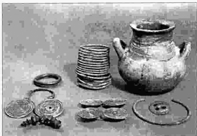
Sl. 3. Široko kraj Suve Reke. Nalazi suvorečke grupe. Brončano doba. Abb. 3. Široko neben Suva Reka. Funde aus der Bronzezeit.

ionicu (fornaces) ili neki revir (putei) odakle je crpio rudaču trebali su biti veoma bogati. Međutim, i to je bilo u zakupu. Osim ovih socijalnih struktura, postojalo je i ropstvo, koje u gospodarstvenom životu, istina, nije imalo značajnu ulogu. No i oni su bili carski vlasnici i kao liberti posjedovali su malo bogatstvo (peculium) ili su pak bili carski službenici (vilici) koji su potvrđeni i na današnjem teritoriju Kosova. Ovaj je socijalni sloj bio vlasništvo i bogatih obitelji, kao što je to slučaj obitelji Furi.