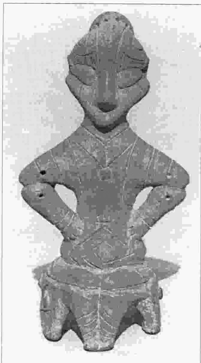
Sl. 2. Neolitička statuetta vinčanske kulture.