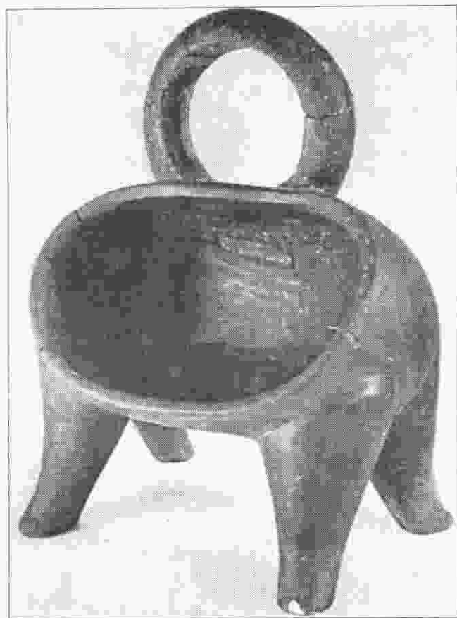
Sl. 1. Reštani kod Suve Reke. Neolitički riton.

Abh. 1. Reštani neben Suva Reka. Jungsteinzeitliches Rhyton.