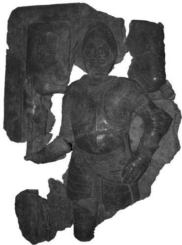
Slika 6: Ulomci nadgrobne ploče s prikazom člana obitelji Zrinski pronađeni u Šenkovcu 1924. godine, Muzej Međimurja Čakovec

Zrinski u Međimurju, dodatna vrijednost toga objekta je i u tome što je u sakralnoj arhitekturi na području Međimurske županije renesansa gotovo u potpunosti nepoznata. Milan Pelc za taj tip centralne građevine uzore nalazi u prvoj istinskoj renesansnoj kapeli centralnog tlocrta koju je u Esztergomu sagradio ugarski primas i kancelar Ugarskog Kraljevstva kardinal Toma Bakač u periodu od 1505. do 1521. godine, te u centralnoj kapeli, mauzoleju poljskog kralja Sigismunda I. u Krakovu, koja je popularizirala takav tip građevina među plemićima i dostojanstvenicima diljem Poljskog Kraljevstva, te sugerira utjecaj i na sjevernohrvatske krajeve. 114 Bočna kapela, mauzolej koji gradi Franjo Taši nastaje ranije od onog u Šenkovcu, jer podatak da je grobnicu obitelji Zrinski izgradio sigetski junak Nikola Zrinski, koji donose Josip Bedeković i Rudolf Horvat, nije točan, 115 jer se u ispravi od 27. siječnja 1627. godine navodi da je za sahranu tijela grofa Jurja V., koji umire 1626. godine, izgrađena nova kapela uz samostan Blažene Djevice Marije i sv. Jelene kod Čakovca. 116 Ta građevina očuvala nam se u svojoj temeljnoj zoni, a otkrivena je u drugoj kampanji ranije spomenutih arheoloških istraživanja provedenih 1924. godine. Tada je utvrđeno da je kriptu kapele u potpunosti prazna, odnosno da u njoj više nije bilo kosturnih