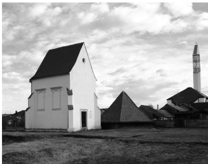
Slika 2: Pogled na današnju kapelu sv. Jelene i natkrivene temelje bočne kapele, tzv. mauzoleja obitelji Zrinski u Šenkovcu, stanje 2010. godine

Ona je najvrjedniji svjedok prisutnosti pavlina na tom mjestu, a zajedno s čitavim samostanskim kompleksom, koji je očuvan u arheološkom sloju, čini materiju vrijednu znanstvenog istraživanja (slika 2). Od 1990. godine do danas vlasnik kapele sv. Jelene i njezina neposrednog okoliša na kojem je smješten dosad istražen dio samostanskog kompleksa je Muzej Međimurja Čakovec, koji je ujedno i nositelj programa njezova istraživanja, obnove i prezentacije. Prva poznata arheološka istraživanja toga samostanskog kompleksa provela su 1924. godine Braća Hrvatskog Zmaja, a njihov voditelj bio je Emil Laszowski, koji je dio rezultata tih istraživanja i publicirao. 2 Istraživanja su provedena u dvije