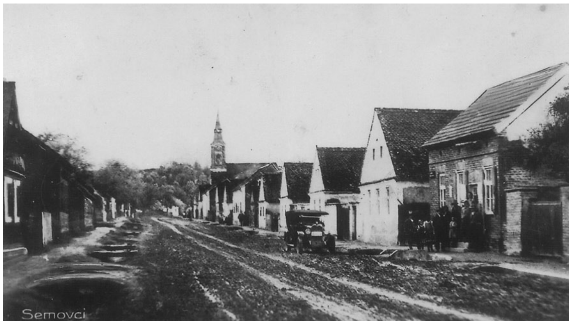
Slika 2. Šemovci - glavna ulica 1920-ih godina

kasnije su ga članovi obitelji Cvetković prenijeli u svoju klijet. 25 Danas klijet obitelji Cvetković više ne postoji, ali sačuvana je greda sa urezanim natpisom koja je u vlasništvu obitelji Perok.