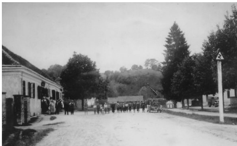
Slika 3. Šemovci - prizor s glavne ulice oko 1930. godine

Zanimljivo je ovdje kratko spomenuti i postojanje križeva / raspela na raznim lokacijama u Šemovcima. Primjerice, sigurno je, prema zapisima župnika Šantuša u Spomenici župe Virje iz 1875. godine, da se općinsko vijeće u Virju obvezalo se da će brinuti za održavanje križeva na šemovečkom starom i novom groblju, kao i na cesti u Šemovcima kod Vinkovićeve kuće. Župnik je 1880. u Spomenici zapisao da je veliko raspelo u Šemovcima na glavnoj cesti s godinama dotrajalo i trebalo ga je obnoviti, pa je tadašnja imovna općina đurđevačka dala hrastovo drvo za križ, a sliku je obojio Bonifac Affinger. 39 U jesen 1924. godine je ugledni mještatin Stjepan Kolarević dao postaviti raspelo na raskrižju ispred škole u spomen na 25 poginulih iz Šemovaca tijekom Prvoga svjetskog rata. Posvetu je 1. veljače 1925. obavio kapelan Šmit uz nazočnost mnoštva vjernika. 40 Pored križeva u selu postojali su od davnina i križevi na putevima kroz vinorodne brežuljke na šemovečkom području. O tome bar zasad nemamo pisanih tragova, ali postoji usmena predaja koja svjedoči da su se na raskrižjima nalazila drvena raspela koja su najčešće održavali posjednici okolnih parcela.