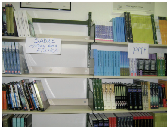
S l i k a 2 – Knjige nalaze svoje mjesto na policama