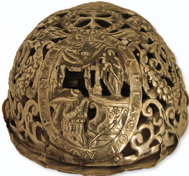
Slika 6. Moćnik glave Sv. Stjepana Ugarskog - detalj s prikazom kralja Stjepana kako kleči pred Gospinim kipom, Dijecezanski muzej u Stolnom Biogradu. Dubrovnik, 16. stoljeće