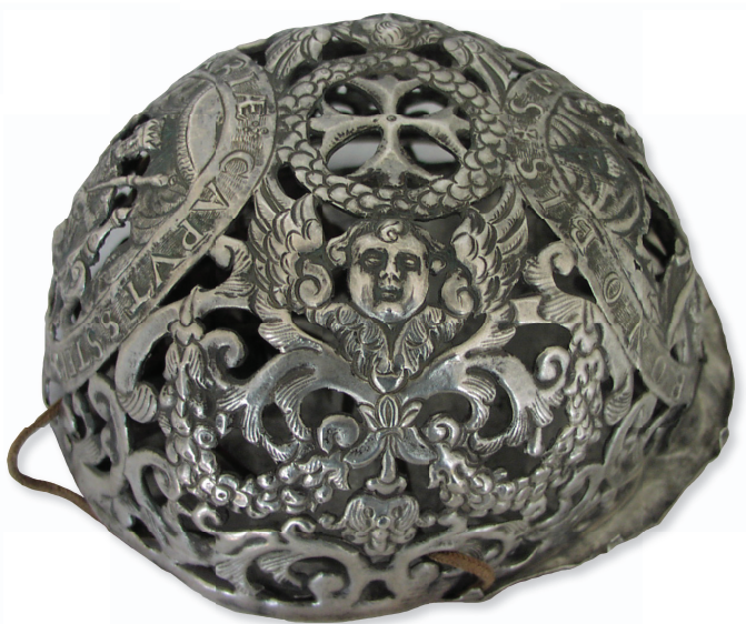
Slika 7. Detalj moćnika glave Sv. Stjepana Ugarskog iz Dijecezanskog muzeja u Stolnom Biogradu. Dubrovnik, 16. stoljeće