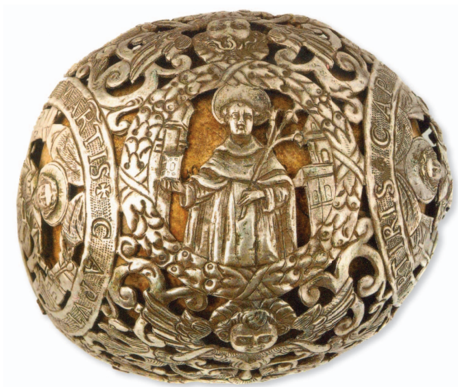
Slika 3. Detalj moćnika glave Sv. Kuzme i Damjana iz Dominikanskog samostana u Dubrovniku, 16. stoljeće