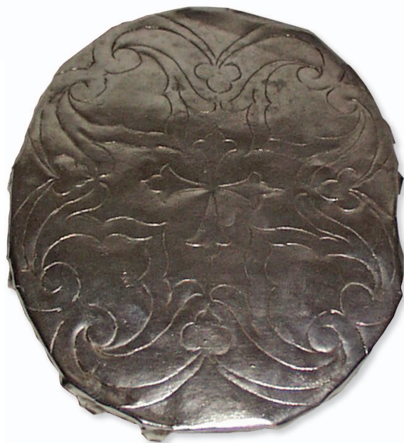
Slika 8. Dno moćnika glave Sv. Stjepana Ugarskog iz Dijecezanskog muzeja u Stolnom Biogradu. Dubrovnik, 16. stoljeće