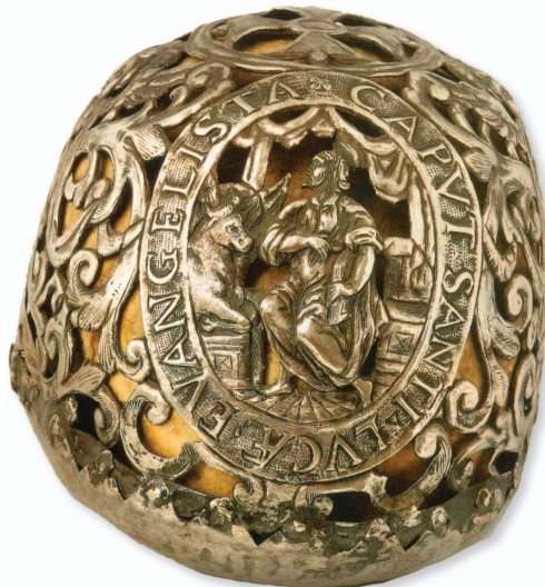
Slika 2. Moćnik glave Sv. Luke iz Dominikanskog samostana u Dubrovniku, 16. stoljeće

zastor tvori scenski efekt, a mladoliki svetac prikazan je kako u jednoj ruci drži liječnički instrument, a u drugoj drži liječničku škrinjicu, svoj ikonografski simbol. Uokolo teče natpis: CAPVT.SANCTI.DAMIANI.MARTIRIS. Na drugom medaljonu prikazan je Sv. Kuzma s istim liječničkim simbolima, u kratkom haljetku s velikim okovratnikom. I ovaj svetački lik, poput Sv. Damjana, iskucan je u perspektivnom prikazu, a perspektivi pridonosi radijalno izvedeno popločanje donje zone reljefa. Zlatar koji ih je izrađivao služio se, po svemu sudeći, grafičkim prikazom iz neke od onodobnih crkvenih knjiga. Oko medaljona teče natpis: CAPVT.SANCTI.COSMIANI.MARTIRIS. Oba medaljona povezana su iskucanim srebrnim reljefom vitica i voćnih girlandi, izvedeni u istoj tehnici “na proboj”, ostavljajući vidljivom lubanju koja se čuva unutar moćnika.