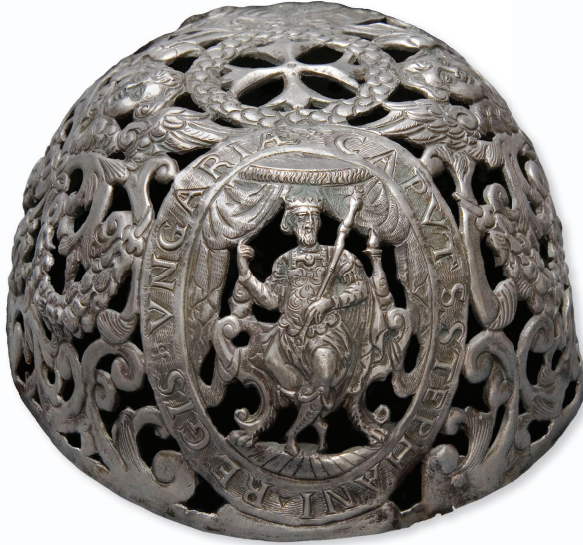
Slika 5. Moćnik glave Sv. Stjepana Ugarskog - detalj s prikazom kralja Stjepana na prijestolju, Dijecezanski muzej u Stolnom Biogradu. Dubrovnik, 16. stoljeće