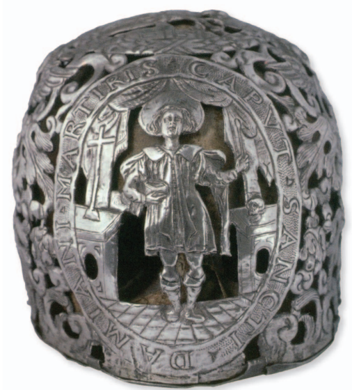
Slika 1. Moćnik glave Sv. Kuzme i Damjana iz Dominikanskog samostana u Dubrovniku, 16. stoljeće

tako, ovi moćnici nastali su na tradiciji moćnika glavâ u Dubrovniku. Moćnici glavâ reprezentanti su srednjovjekovne duhovnosti šovanja dijelova tijela svetaca. Stoga možemo govoriti o anatomskim moćnicima koji reproduciraju dio tijela koji predstavljaju. Skupina moćnika glavâ u Dubrovniku više od šest stotina godina pod stalnim je utjecajem carske krune, čiji je prauzor moćnik glave Sv. Vlaha. Skupina moćnika glavâ iz Dominikanskog samostana u Dubrovniku pripada skupini moćnikâ u obliku pogače, spljoštenog oblika, arhaične forme, potvrđujući iznova dubrovačku konzervativnu crtu u zlatarstvu tijekom niza stoljeća. 8