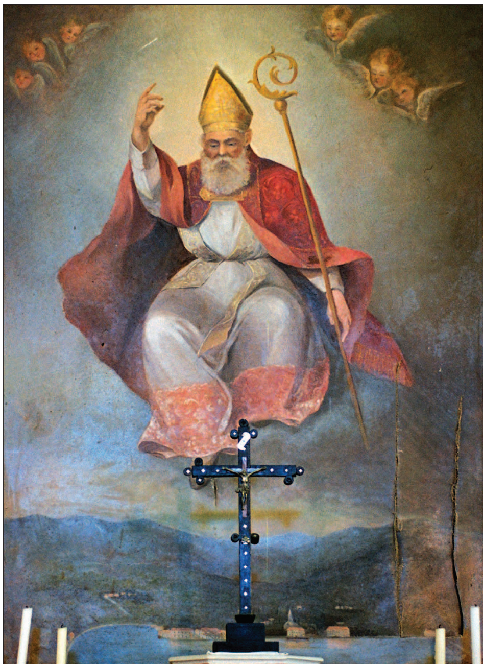
Slika 4. Jelka Bizzarro, Sv. Vlaho (1915, Župna crkva Sv. Vlaha, Slano)