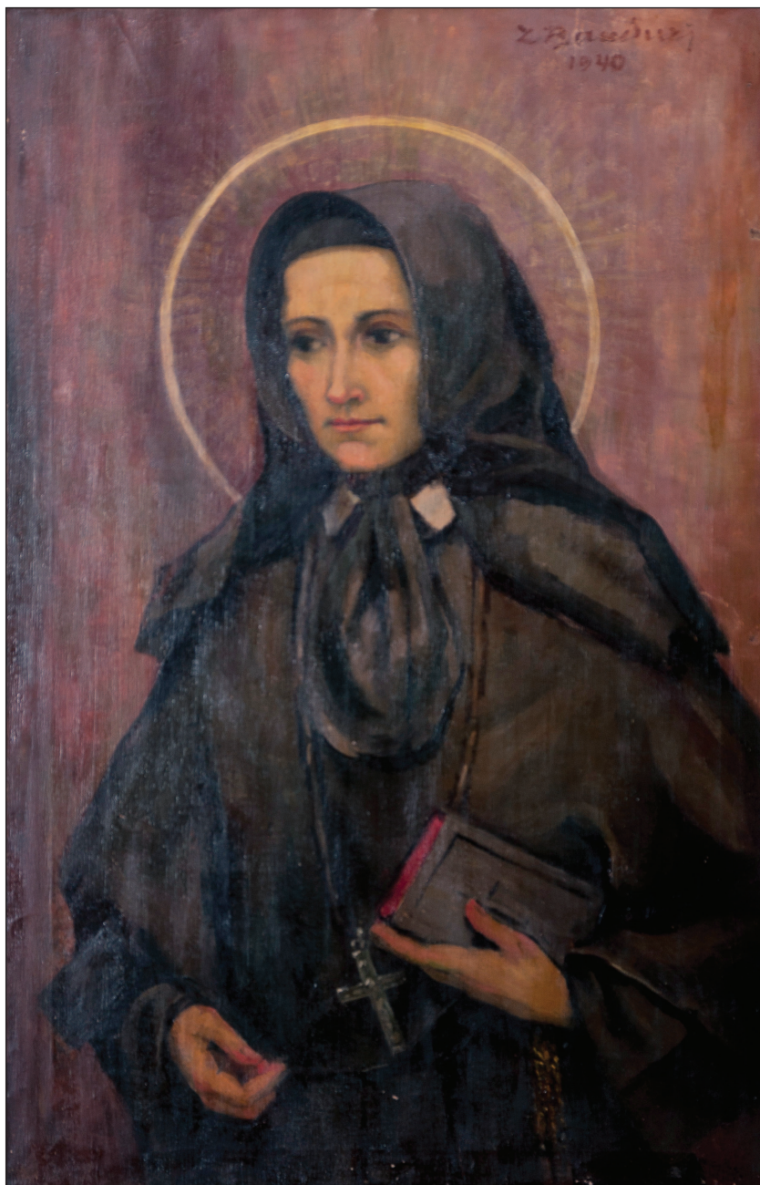
Slika 10. Zenaída Bandur, Sv. Marija Krucifiksa di Rosa (1940, Samostan službenica milosrđa, Dubrovnik)