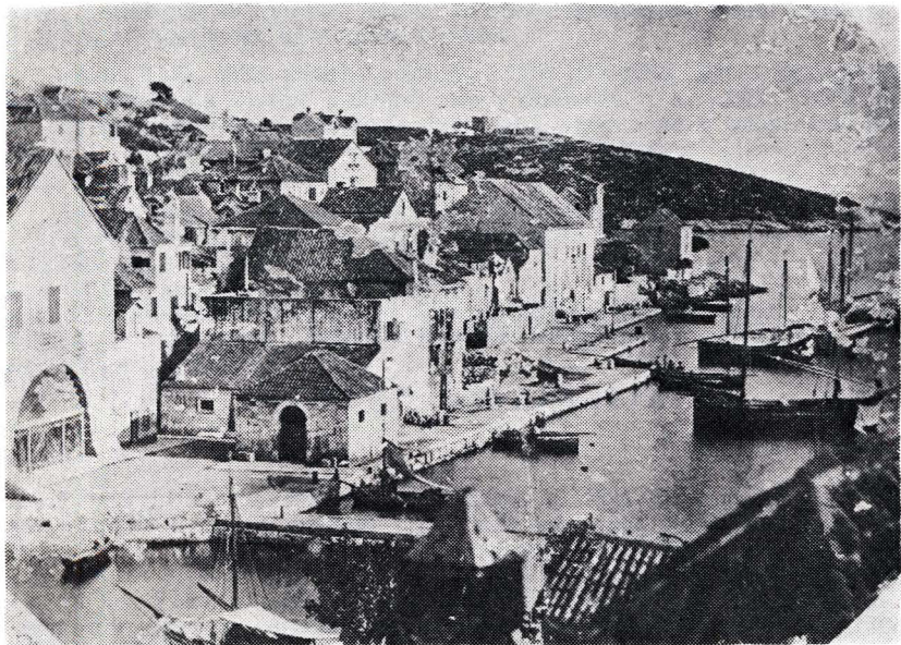
Fotografija jugo-istočne obale hvarske luke snimljena nakon radova koji se u članku opisuju. U prvom planu (centralno), vjerojatno zgradica koja se u tekstu navodi kao gabela.

traži kameni napis (»scogliera«) od 10 klaftera dužine za zaštitu. Tu mora biti ovaj naš mali gat predviđen pod d), ali do gradnje odnosno nanosa kamena nije nikad došlo, iako je za to predviđeni trošak od samih 138 forinti bio skroman.