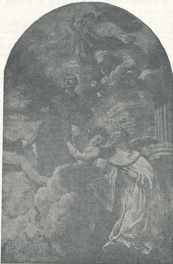
Glorifikacija sv. Antuna iz Franjevačkog samostana u Hvaru

Namaz boje na veduti je svježiji i tanji od onog slike, a boja egzistira sasvim drugačije od one kompletne slike. Veduta je načinjena sumarnom kompozicijom i gotovo je monokromna u ograniče-