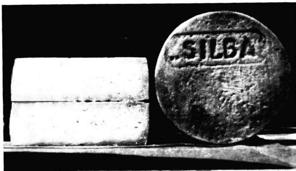
Sir iz Ovčarsko-mljekarske zadruge Silba

Prolazeći brodom uz ove otoke teško je strancu vjerovati, da na onim kamenjarama i rijetkoj makiji može živjeti ovca. Krš je degradiran i vegetacija je u stalnom regresu, te su pašnjaci na otocima vrlo oskudni. Osim toga sušno i vruće ljeto osuši sve zeleno. Međutim ovca, koja je dosta sitna, dobro je prilagođena ovim prilikama, te prelazeći velike površine nalazi i najmanju travku. Na nekim otocima, kao na Pagu i Silbi, nikad se ovca ne zaklanja pod krov, a to je moguće radi blage zime. Ovca pase u ograđenim pašnjacima bez pastira