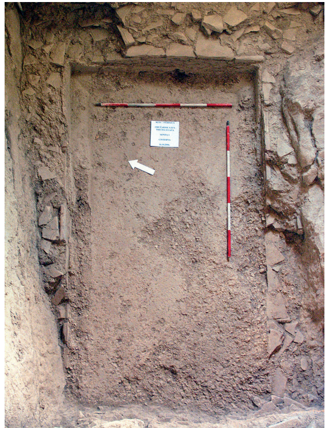
Slika 2. Ostaci antičke cisterne u oružarnici

U svojoj Povijesti Gotskoga rata ( Bellum Gothicum I , 7) Prokopije iz Cezareje opisuje veliku bitku za Salonu i njezinu okolicu koju 536. godine s Gotima vode Justinijanovi vojskovođe Mundo i Konstancijan. Prije nego će zauzeti