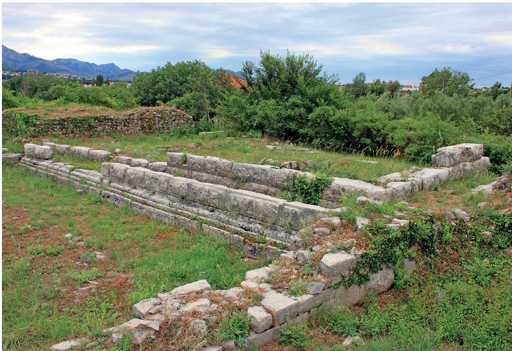
Slika 12. Donji dijelovi salonitanskoga kapitolija zidani blokovima modraca