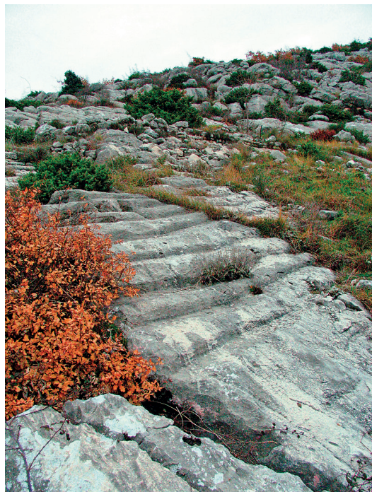
Slika 8. Uklesano stubište na Gradini