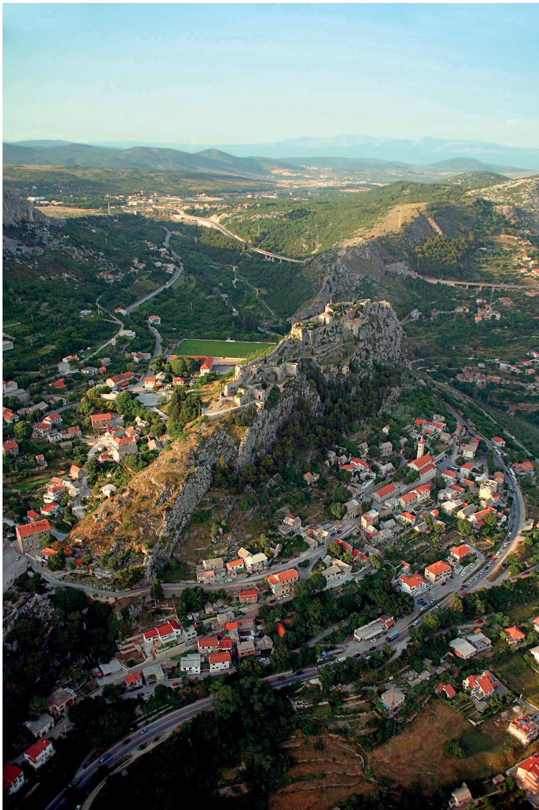
Slika 1. Kliški prijevaj i tvrđava