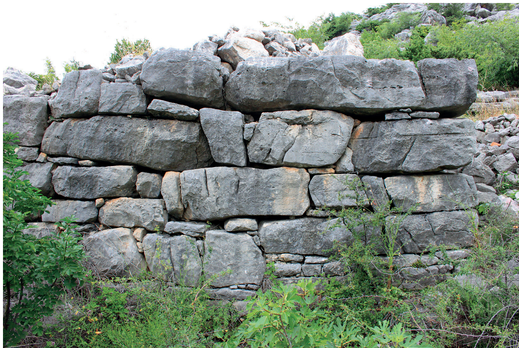
Slika 6. Kameni blokovi u jugoistočnom dijelu Gradine