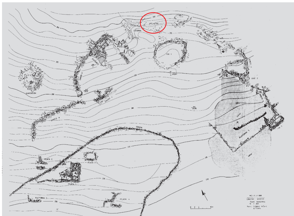
Slika 4. Tlocrt lokaliteta Gradina (naznačen položaj natpisa) u Klis-Kosi (J. Mardešić 2002, str. 40)