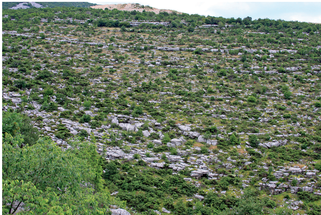
Slika 10. Ležišta kamena pored Gradine u Klis-Kosi

pleksa u svakodnevnom životu. Smještena je vrlo logično, na dnu ravne strme hridi čija je površina prekinuta jednom izduženom stubom/kanalom koji je vjerojatno sakupljao kišnicu za punjenje cisterne. 50 Mosor i Kozjak inače su poznati po tome što se niz ovakve hridi voda slijeva još dugo nakon prestanka kiše.