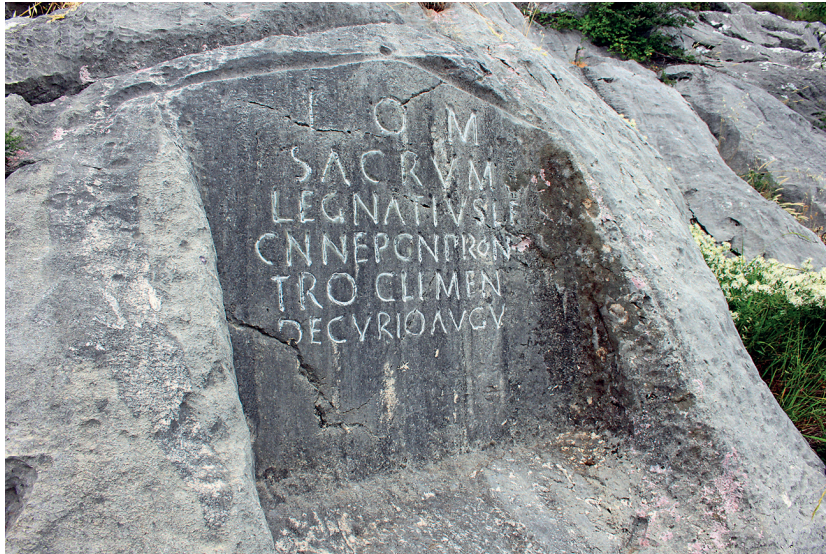
Slika 5. Posvetni natpis Lucija Egnacija Klementa

riol Gradinu kod Uvodića ponovno uvodi u znanstvenu literaturu i započinje s istraživanjem i dokumentiranjem lokaliteta. 39 On je pretpostavljao strateško-fortifikacijsku ulogu ovoga objekta kao mjesta koje je Salonu moglo štiti u slučaju neprijateljskoga obilaska Klisa i prodora preko Mosora. Imajući u vidu pojedine lokalitete na samom jugozapadnom dijelu Mosora (gradina Kapina, gradina iznad Kučinskih doca), ovakva pretpostavka je moguća, 40 dodali bismo, za prapovijesno ili kasnoantičko vrijeme. I Buškariol je nekoliko puta naglašavao kako na Gradini nije pronađena prapovijesna keramika. On je kasnije ipak odbacio razmišljanje o fortifikacijskoj funkciji 41 te se priklonio pretpostavci kako je objekt iznad Uvodića imao sakralno-stambeni karakter. 42 Od tada se razmišljanja o njemu kreću između te dvije pretpostavke. 43 Ovdje bismo pokušali otići korak dalje i Oltarine ili Gradinu dovesti u kontekst okolnoga prostora. Jednim dijelom i vrlo kratko to je već napravljeno prepoznavanjem njezine funkcije uz cestovni pravac od Salone prema Klisu (preko današnje