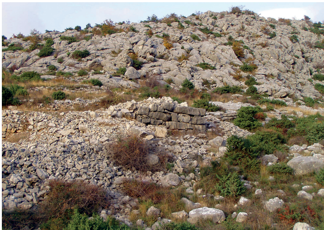
Slika 7. Kameni blokovi u jugoistočnom dijelu Gradine i devastirani nasip (snimio Ivan Alduk, 2014.)