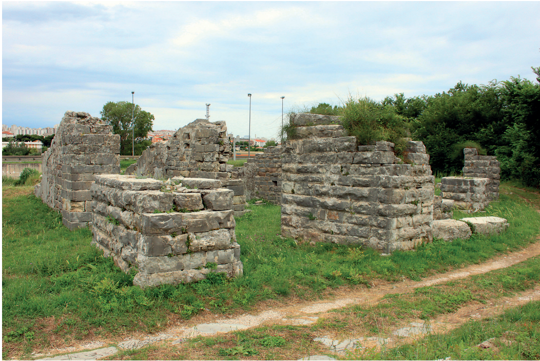
Slika 11. Piloni salonitanskoga teatra zidani blokovima modraca