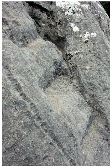
Slika 9. Tragovi klesanja kamena živca na liticama Gradine

na padinama Mosora iznad Kliškoga polja gdje se takav kamen, ali i »obični« vapnenac, nalaze na površini i doslovno se odlamaju u pravilnim oblicima, najčešće u formi izduženih ploča ili blokova koji onda zahtijevaju minimalnu obradu. 47 A vrijeme kada se datira Klementov natpis iz Uvodića upravo je vrijeme kada u Saloni nastaje najveći broj građevina u čiju se konstrukciju ugrađuju i mosorski kameni blokovi. Možemo li stoga unutar kompleksa iznad Uvodića, koji je okružen mosorskim modracem i vapnencom, smjestiti nastambe ili radionice dijela salonitanskih kamenara (kamenorezaca, kamenoklesara i »kavadura« – kamenolomaca) uz koje su imali i svetište posvećeno Jupiteru?! Laporasti kamen koji se tamo vadio koristio se najčešće kao građevni materijal jer nije pogodan za izradu arhitektonske dekoracije i sl. U prilog ovoj pretpostavci ide nekoliko više ili manje uvjerljivih činjenica.