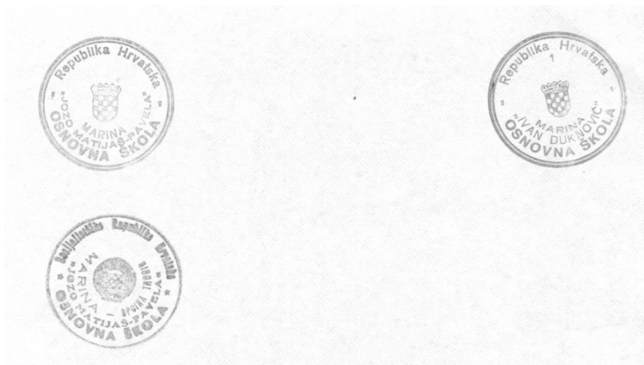
Sadašnji i prijašnji pečati OŠ "Ivan Duknović", Marina.

I. Pažanin, Školstvo u trogirskom kraju u 19. i 20. stoljeću, Rad. Zavoda povij. znan. HAZU Zadru, sv. 42/2000, str. 333-412.