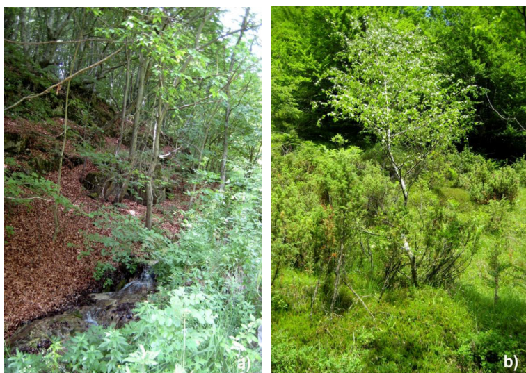
Slika 3. Potpodručje 2 – potok Kupčina: a) osojna strana s bukovom šumom, b) prisojna strana s travnjakom u podmakloj sukcesiji.

potpodručje predstavlja mozaik ostatka suhog kontinentalnog travnjaka na obroncima i elemenata vegetacije bazofilnog ravnog creta uz vodene trakove potoka Kupčina. Na relativno strmim prisojnim obroncima ove udoline nekada je bio razvijen travnjak razreda Festuco-Brometea , asocijacije Seslerietum kalnikensis Horvat 1942 (prilog 1), i očuvan je u boljem stanju nego travnjak na potpodručju 2. Stoga je prisutno i više karakterističnih vrsta. Uz kalničku šašiku ( Sesleria kalnikensis ) i prethodno spomenute vrste ( Scabiosa columbaria , Sanguisorba minor , Koeleria pyramidata , Genista januensis , Buphthalmum salicifolium , Carlina acaulis ), prisutne su i sljedeće karakteristične svojte: pravi ranjenik ( Anthyllis