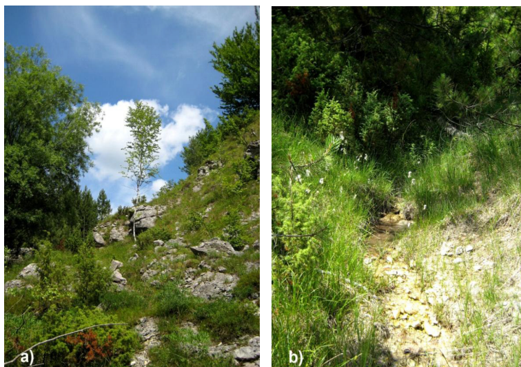
Slika 4. Potpodručje 3 – gornji tok Kupčine s pripadajućim trcima: a) travnjak u sukcesiji na obroncima, b) jedan od trakova Kupčine sa suhoperkom ( Eriophorum ).

Neposredno uz i u plitkim dijelovima potoka Kupčina, te njegovim trakovima koji se slijevaju niz obronke, prisutni su elementi niskog bazofilnog creta suhoperke (As. Eriophoro-Caricetum paniceae Horvat 1964, prilog 1) (Topić i Vukelić 2009) s karakterističnim vrstama kao što su: uskolisna i širokolisna suhoperka ( Eriophorum angustifolium i E. latifolium ), prosasti šaš ( Carex panicea ), močvarna talija ( Parnassia palustris ), čaškasta baluška ( Tofieldia calyculata ) i dr.