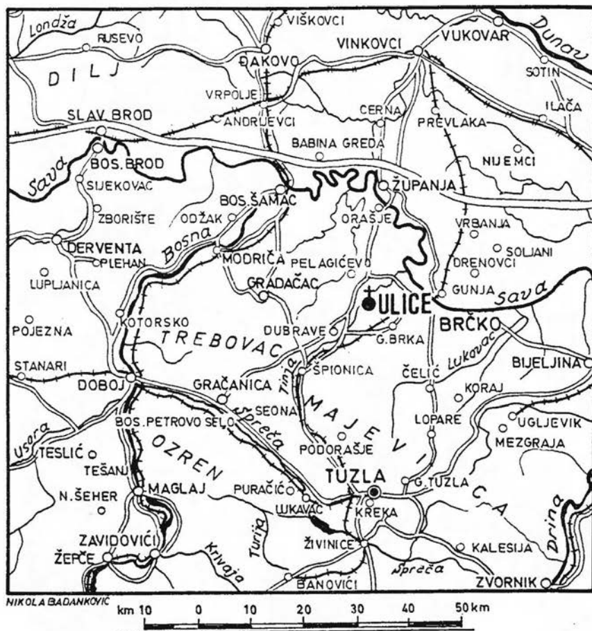
Slika 2: Ulice i okolica – kartografski prikaz