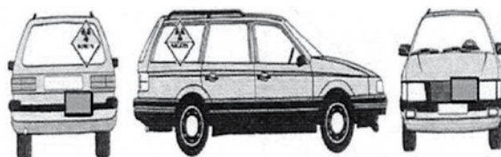
Slika 3. Označeno vozilo za prijevoz radioaktivnog materijala

Prijevoz uključuje sve radnje i stanja povezana s premještanjem radioaktivnoga materijala, i to: izradbu, proizvodnju, održavanje i popravak ambalaže te pripremu, otpremu, utovar, prijevoz – uključujući skladištenje u provozu – istovar i prihvaćanje pošiljki radioaktivnoga sadržaja i pakiranja na konačnomu odredištu.