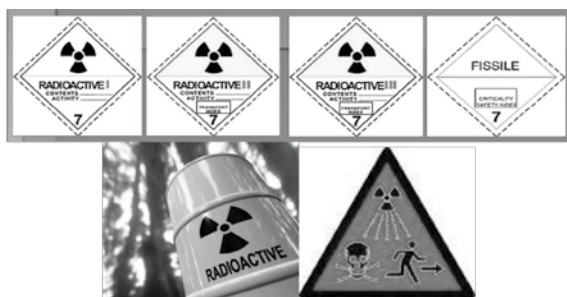
Slika 2. Označavanje radioaktivnog materijala

Limitirane količine radioaktivnog materijala, a sastavni su dio instrumenata ili drugih naprava, koje predstavljaju vrlo ograničeni radioaktivni rizik, također se mogu prevoziti, ali kao posebni paketi. To su: