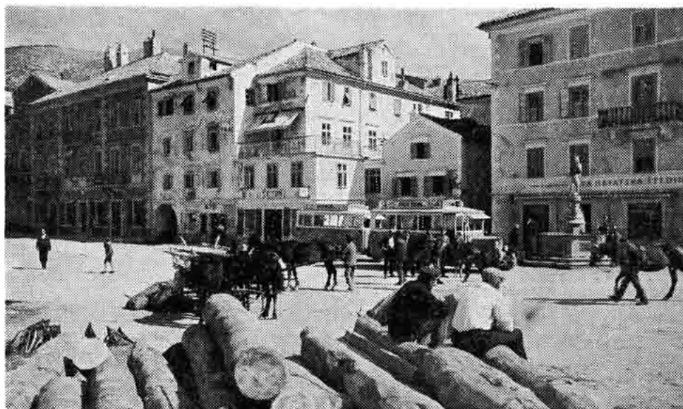
Sl. 9 — Senj, na obali stari »stapredi«, fontana s ribarom ispred Prve hrvatske štedionice, oko 1930.

Trgovci su se nalazili u nešto boljem položaju od obrtnika i radnika, ali godišnje oscilacije u broju članova pokazuju da je i trgovina Senja prolazila kroz česta krizna razdoblja i da se u Senju živjelo teško, štedljivo i oskudno. Usprkos obećanju Senj u čitavom međuratnom razdoblju stagnira. Država zanemaruje tvornicu duhana, luku i ceste prema unutrašnjosti, pa je život iz dana u dan sve teži, jer se razvijaju druga mjesta, koja su se u odnosu na Senj nalazila u boljem položaju.