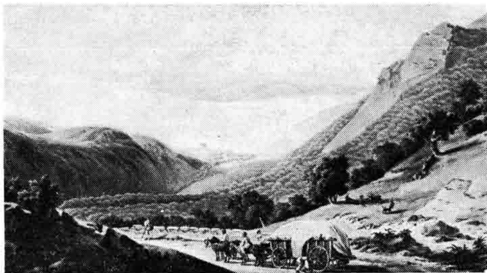
Sl. 7 — Lički kirijaši na prijevoju Vratnik — silaz Jozefinom u Senj, F. Jasche, 1807.

U ovom prilogu nastojala sam istražiti život socijalno-privrednih društava koja su bila od interesa i za radnike i za poslodavce.