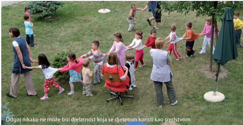
Odgoj nikako ne može biti djelatnost koja se djetetom koristi kao sredstvom

Proturajčno je, međutim, reći da 'učitelj ne može sjediti u razredu jer nije kreativan i samostalan ', ako on istodobno mora ostvarivati propisani mu program bez mogućnosti suodlučivanja ili (kakve li strahote!?) samoupravnog sudjelovanja u njegovom oblikovanju. Kakvu se to kreativnost i samostalnost može očekivati od onih koji u svakom trenutku moraju znati i voditi računa o tome tko ih plaća (hrani) i što on od njih očekuje. Jer čak i da mogu i da mu žele 'stvaralački ugoditi', kako mogu znati da neće promašiti. A ako to ne mogu znati, nije li za njih bolje da i ne pokušavaju.