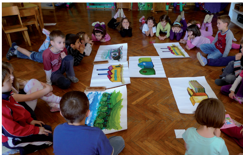
Naši postupci i odnos prema djeci, roditeljima i ostalim suradnicima odražavaju se na njihovu sliku o nama kao profesionalcima

sati dnevno tijekom najvažnijeg razdoblja djetinjstva. U vrtiću dijete stječe neka od prvih znanja, razvija svoje sposobnosti i vještine, razvija svoju ličnost, a u tome ga vode i potiču odgajatelji. Stoga je uloga svih odgojno-obrazovnih djelatnika izrazito važna za dobrobit djeteta. Značajne su njihove profesionalne kompetencije, emocionalne kompetencije, njihovi osobni vrijednosni sustavi kojima se vode