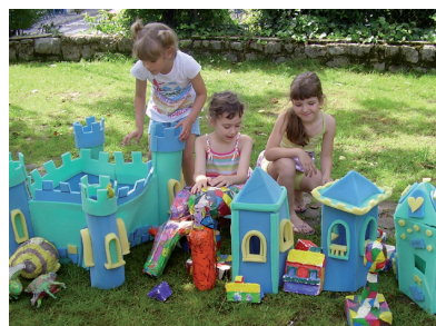
U kreiranju etičkog kodeksa bili smo vođeni sviješću o važnosti zajedničkih uloga u životu djeteta

u kreiranju materijalnog i socijalnog okruženja, građenju odnosa s djecom i njihovim roditeljima, ali i svojim međusobnim interakcijama (sustručnjačkim odnosima, odnosima u kolektivu). Upravo stoga, smatrali smo da je vrlo važno pozornost usmjeriti upravo na njih.