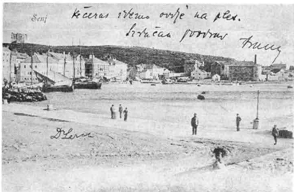
Sl. 18. — Grad Senj i luka, snimak od sjevera, 27. II 1906.