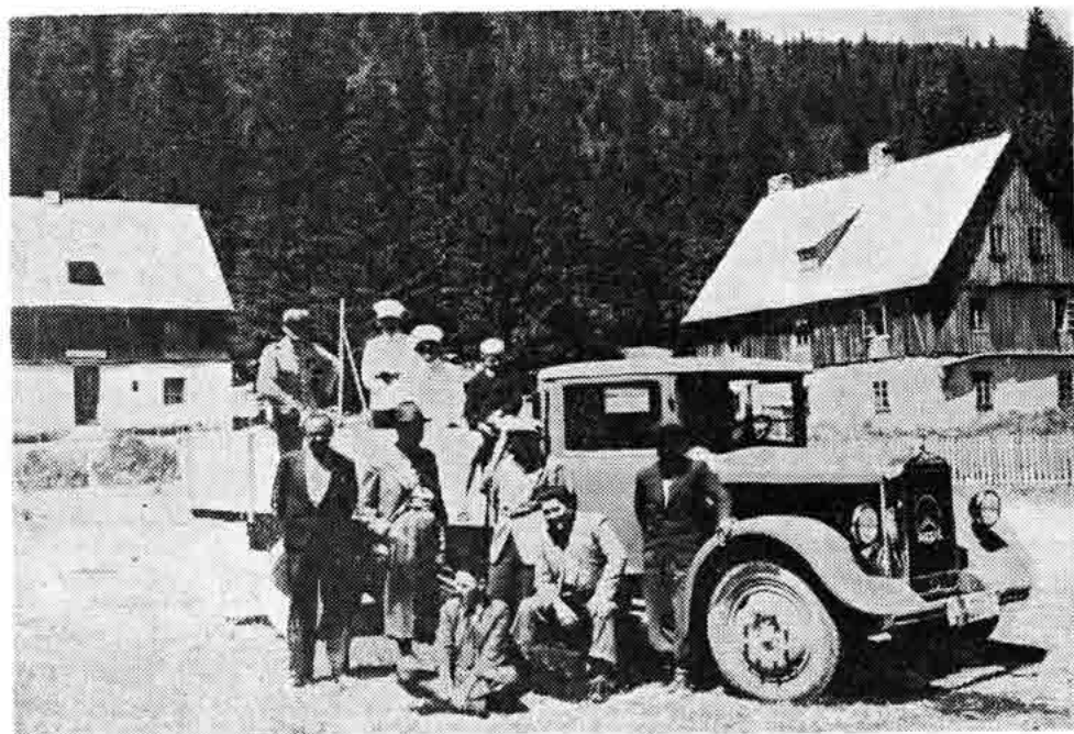
Sl. 16 — Predio Štirovača u sjevernom Velebitu, snimljeno oko 1935.

i građana — pristaša različitih političkih stranaka. U jednom momentu, neuka momčad pogranične trupe ispalila je više hitaca, pa su dvije osobe lakše ranjene».