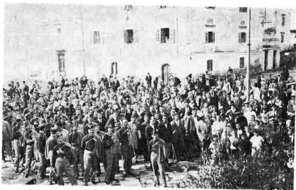
Sl. 28 — Proslava »Hrvatskog sokola« u Senju. Velika placa oko 1930.