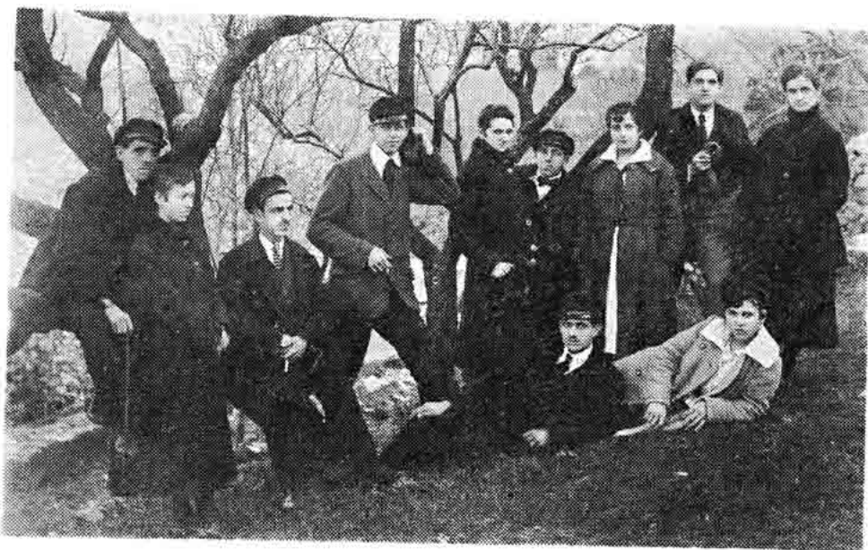
Sl. 29 — Mladi Senjani i Senjkinje snimljeni pod Nehajem oko 1920.