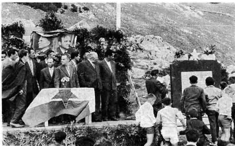
Sl. 37 — Otkriće spomenika palih boraca na proplanku Vrtlina—Alan, 1960. g.