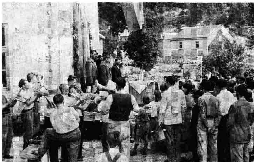
Sl. 36 — Proslava Dana ustanka Hrvatske, narodni zbor u Krivom Putu. Snimak iz 1949.

Iz riječi obojice zrači duboka odanost i vjera u snage socijalizma i Crvenu armiju. Osudom suda Milan Butorac osuđen je kao maloljetnik na 16 mjeseci zatvora, dok su Branko, Braco i Dušan osuđeni na 3 godine zatvora. Iz zatvora u Rijeci odvedeni su zajedno u Kopar, gdje su se posljednji put vidjeli jer je Milan izdvojen i kao maloljetnik otpremljen u maloljetnički zatvor u Firenzu. Napominjem da je Milan nakon izdržane kazne pod pratnjom stražara vraćen u Senj. Nakon povratka odmah se pokušao uključiti u rad te ga otac povezuje s predstavnikom tada postojeće organizacije u Senju. Međutim, nezadovoljan sa stanjem i prilikama u Senju, gdje mu se savjetuje da čita Gorskog i sl. on traži vlastitu angažiranost. Prošavši sve oblike ilegalnog i revolucionarnog rada, on se ne zadovoljava takvim sta-