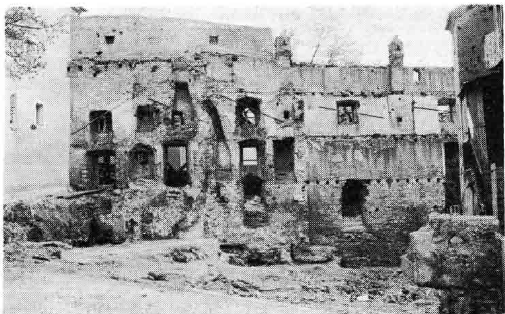
Sl. 54 — Ostaci gradskih zidina na Zgonu, priprema terena za izgradnju kuće penzionera, 1978.