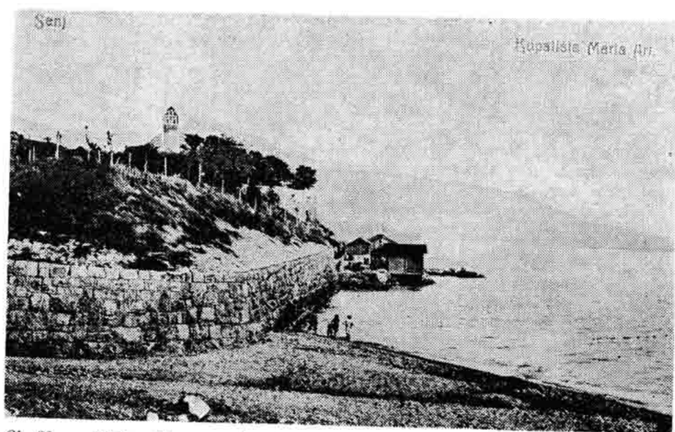
Sl. 88 — Plaža »Điga«, park »Art« i staro vojno kupalište, Senj 23. IX 1909.