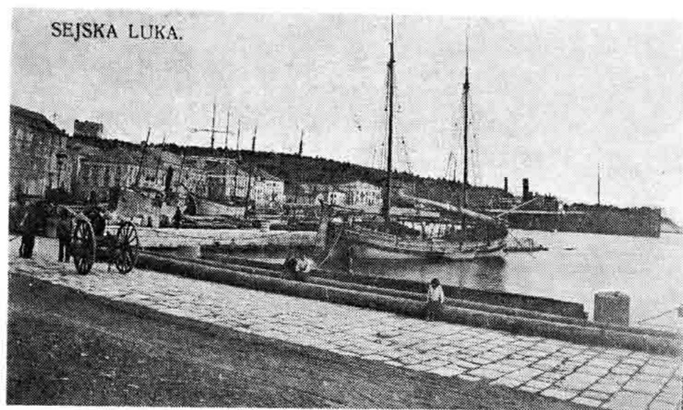
Sl. 90 — Pogled na luku i brodove, Senj 1920.