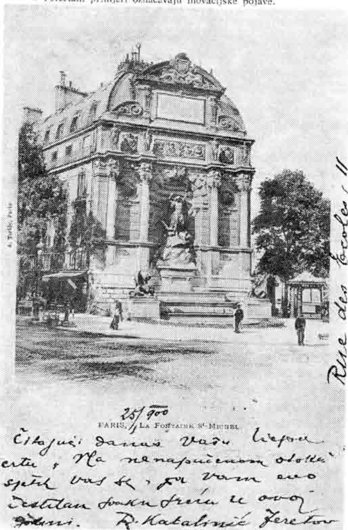
Sl. 93 — R. Katalinić — Jeretov javlja se Vjenceslavu Novaku iz Pariza (25. I 1900.)

15 Potertani primjeri označavaju inovacijske pojave.