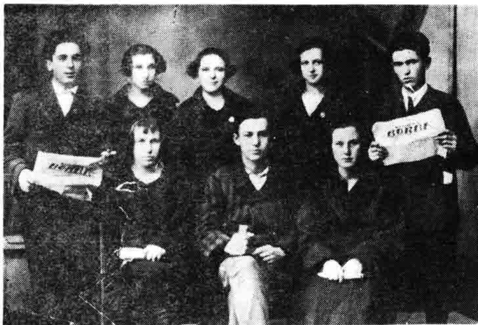
Sl. 26 — Grupa mladih Senjana čitalaca radničke »Borbe«, Snimak iz 1924.

koji se je nalazio na istaknutom mjestu u centralnom rukovodstvu Partije — Partijskom vijeću. 6