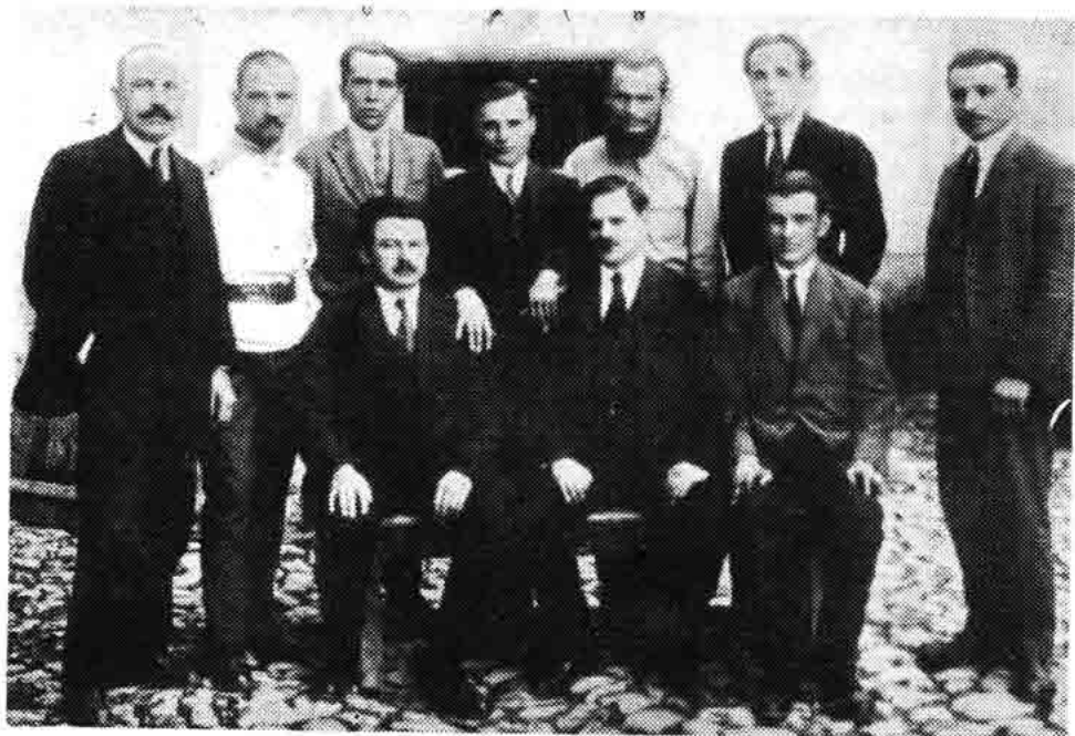
Sl. 41 — Članovi rukovodstva KPJ i komunistički poslanici na robiji u Požarevcu, 1920. Vladimir Čopić stoji drugi slijeva.

Vladimir Čopić bio je i komunistički poslanik u Ustavotvornoj skupštini Kraljevstva Srba, Hrvata i Slovenaca izabran na listi KPJ u modruško-riječkoj županiji. Prelaskom KPJ u ilegalnost poslije Obznane, u prosincu 1920, Čopić je uspostavljao veze centralnog rukovodstva s mjesnim organizacijama koristeći se položajem sekretara komunističkog poslaničkog kluba. Poslije neuspjelog atentata na regenta Aleksandra i Alijagićevog atentata na ministra Draškovića, 1921. komunistički su poslanici bili suspendirani, dok su poslanici članovi Centralnog izvršnog odbora KPJ bili optuženi kao inicijatori i organizatori ovih atentata, što se nije moglo dokazati, pa su na robiju dospjeli osuđeni za propagandu komunističkih ideja. Kaznu su izdržavali u Požarevcu, odakle je Čopić svome advokatu, na prijedlog da podnesu zahtjev za uvjetni otpust, pisao: »Mi smo osuđeni kao propagatori komunističkih ideja i komunističkog programa, za koji je sud konstatovao 'da je u potpunosti svojoj revolucionarnog karaktera'. Tako glasi motivacija u presudi. I kad je reč o uzrocima, zbog kojih smo dospjeli na ovo mesto, onda mi sami otvoreno izjavljujemo: za one koji su nas ovamo uputili, zbog uzroka zbog kojih su nas uputili, mi sami smatramo sebe za nepopravljive. Prema tome ne ćemo moliti uslovni otpust, jer mislimo da tu milost ne zaslužujemo, niti ćemo je ikada zaslužiti. Sa ponosom istrajat ćemo do kraja.«