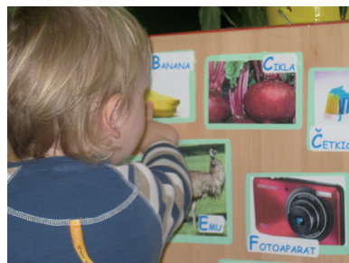
Djeca su u stanju svoje misli izražavati i bilježiti mnogo prije nego znaju pisati