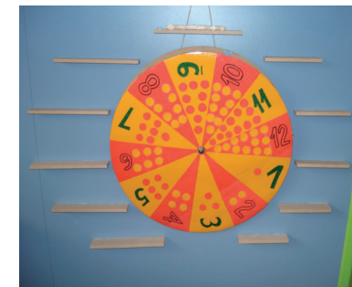
Aktivnosti rješavanja matematičkih problema, pridruženja znamenki skupovima

čitanja i pisanja u kojem smo ponudili knjige, časopise, enciklopedije, pokrivaljke, umetljive, prazne papire i olovke te niz različitih didaktički oblikovanih igara. Prilikom osmišljavanja i izrade ovih materijala posebnu pozornost posvetili tome da djeci budu zanimljivi, poticajni i atraktivni te da ih što više mogu koristiti samostalno ili u suradnji s drugom djecom.