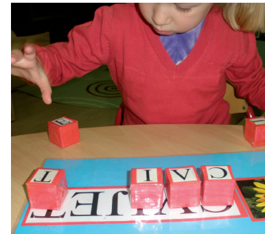
Didaktički oblikovani materijali namijenjeni korištenju slova i igrama slovima