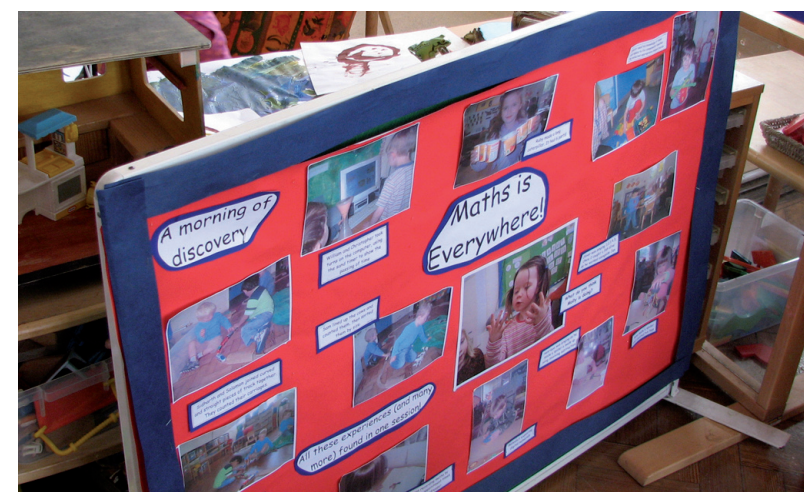
Za roditelje djece koja još ne pohađaju vrtić organizirana je radionica 'Math is everywhere' (Matematika je posvuda)

odvijao početkom srpnja 2007., kad se već uvelike razmišljalo o djeci koja će najesen krenuti u vrtić. Svoje dojmove s tog putovanja željela sam podijeliti s čitateljima časopisa 'Dijete, vrtić, obitelj'.