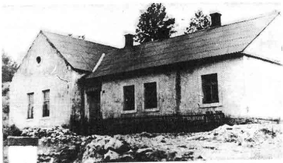
Sl. 74 — Skola u Alanu. U njoj su borci II. čete I bat. »Marko Trbojević« razoružali odred oružnika i rezervista. 29 I 1942.

i njihovih obitelji, i nije dala nekog ozbiljnijeg rezultata u pravcu daljeg razvoja NOP-a u Senju.