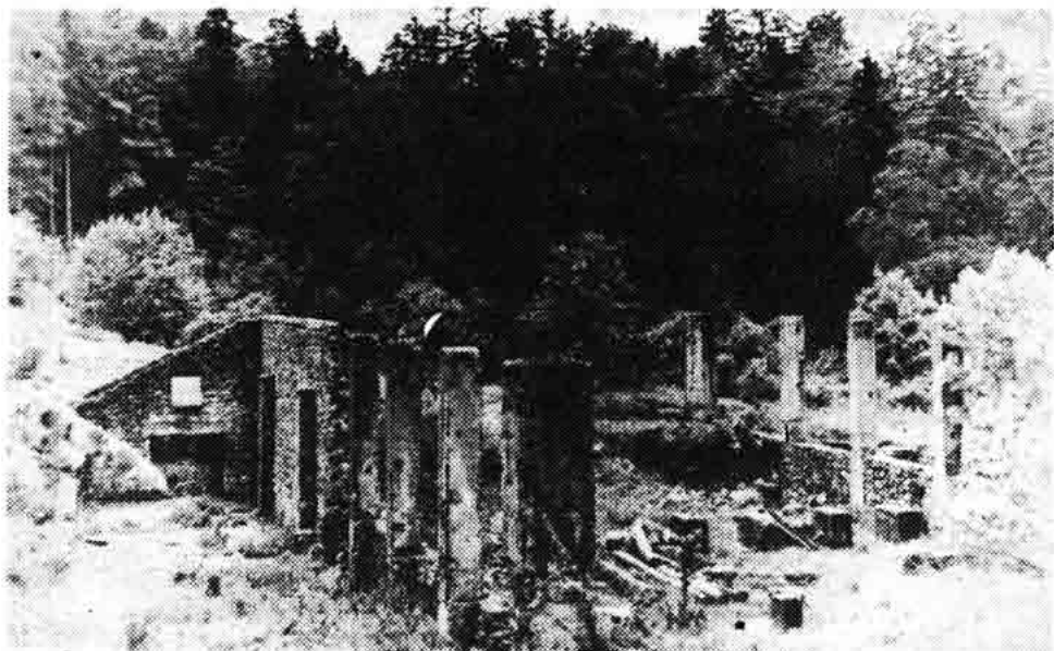
Sl. 73 — Ostaci pilane u Vodicama koju su spalili partizani 15. VIII 1941.