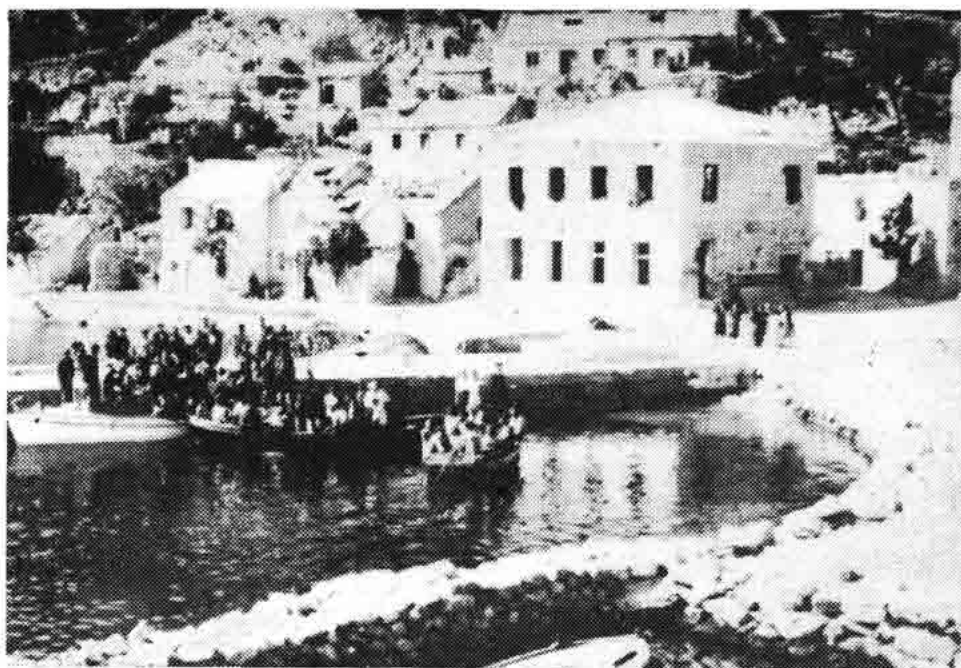
Sl. 78 — Donji Starigrad, stanje poslije oslobođenja, 1946.

Činjenica da je prije dolaska KK bio formiran odred, govori sama za sebe. Već ovdje moram napomenuti, što ni u čemu ne umanjuje značaj naprijed navedenog, da se odmah nakon formiranja odreda pred KK Senj postavilo pitanje kako osigurati rukovodeću ulogu Partije u odredu gdje članova KK nije bilo, odnosno gdje su za rukovodeća mjesta došli nečlanovi.