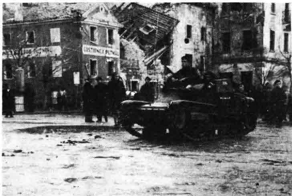
Sl. 79 — Drugovi Dušan Petrović »Sane« i Anton Rončević »Tona« u talijanskom tenku kao pratnja Randolja Churchilla na putu za Otočac. Senj obala, listopada 1943.

obradio drug Petrović. Nešto iza toga, 19. I. 1944., dolazi do prodora njemačkih jedinica i do povlačenja iz Senja. Neprijatelj je za kratko vrijeme napustio Senj za 2 dana tako da su se Komitet i ostale organizacije ponovno spustile u Senj.