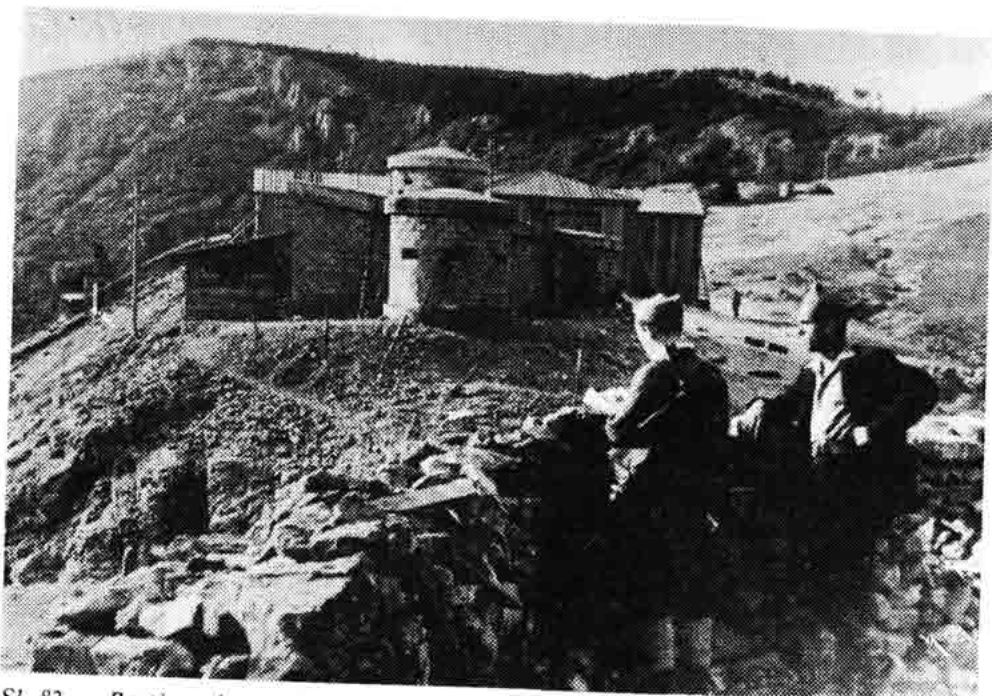
Sl. 82 — Partizanska straža u osvojenom talijanskom bunkeru na prijevoju Vratnik, 11. IX 1943.