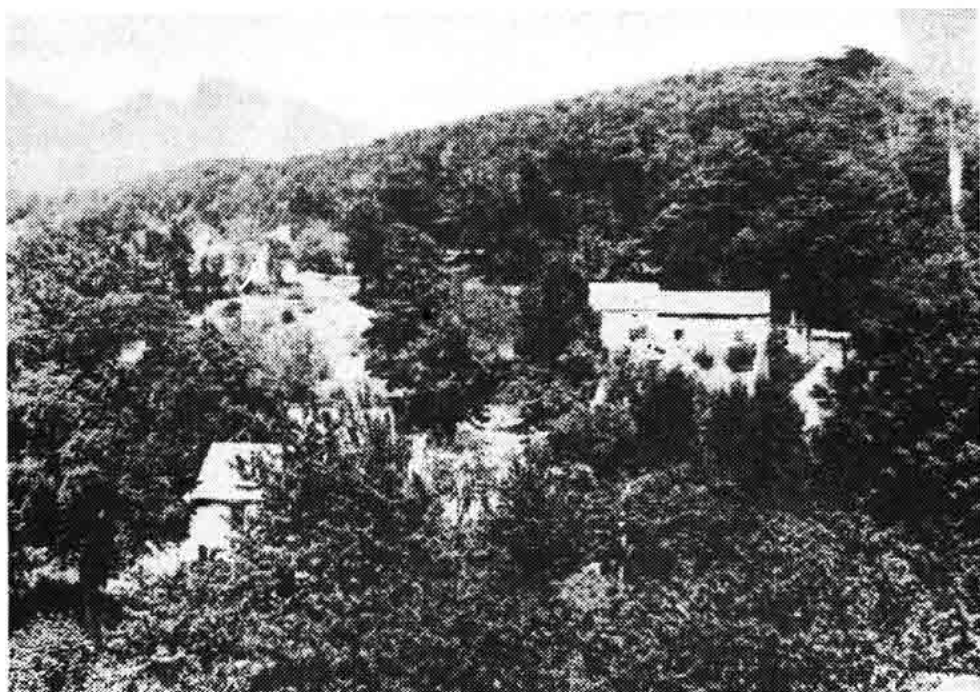
Sl. 75 — Selo ZABUKOVAC za vrijeme NOB-a logor partizanskih jedinica i slobodni teritorij te sjedište političkih organizacija i narodne vlasti, naroda Krmpota, Krivog Puta i Senja.