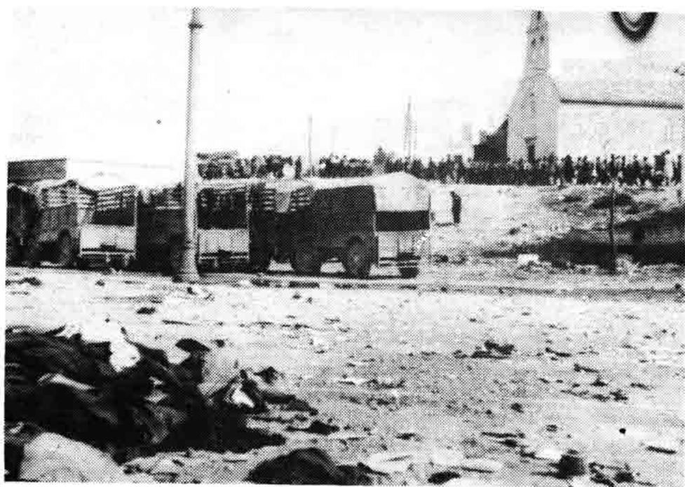
Sl. 80 — Vojnici razoružane talijanske »elitne« divizije »Murgie« odlaze kućama, Senj, cesta F. Vukasovića, rujna 1943.