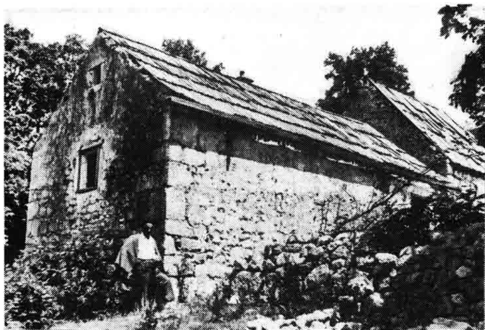
Sl. 76 — Zgrada u kojoj se za vrijeme rata jedno vrijeme nalazio Kotarski komitet KPH Senj.