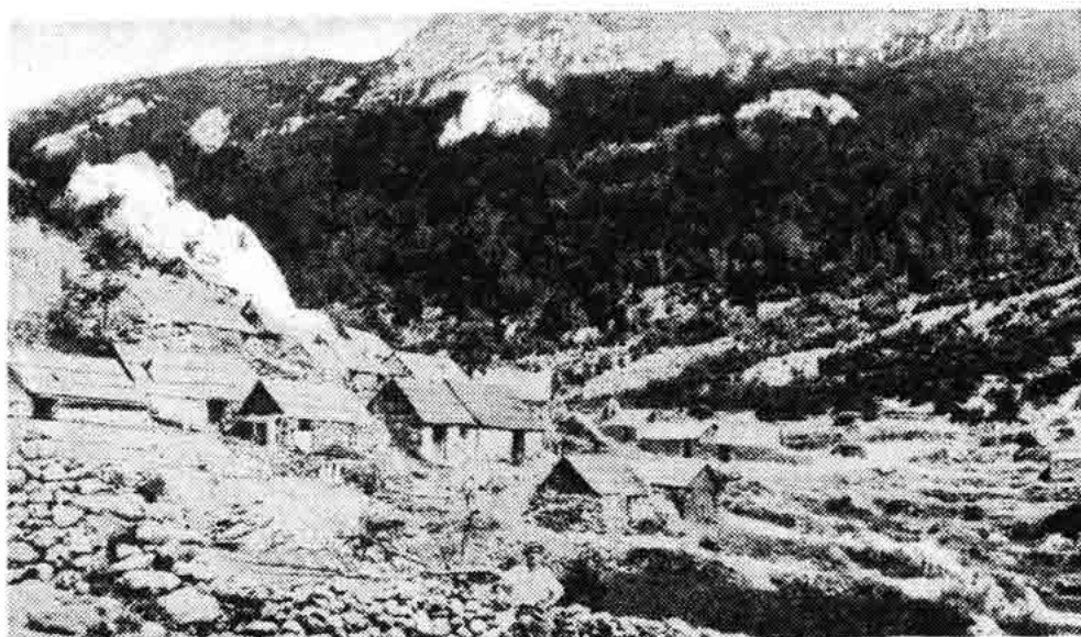
Sl. 96 — Podgorski stanovi »Struge«, sjev. Velebit. Baza i logor podgorskog partizanskog odreda Alan, 1943.