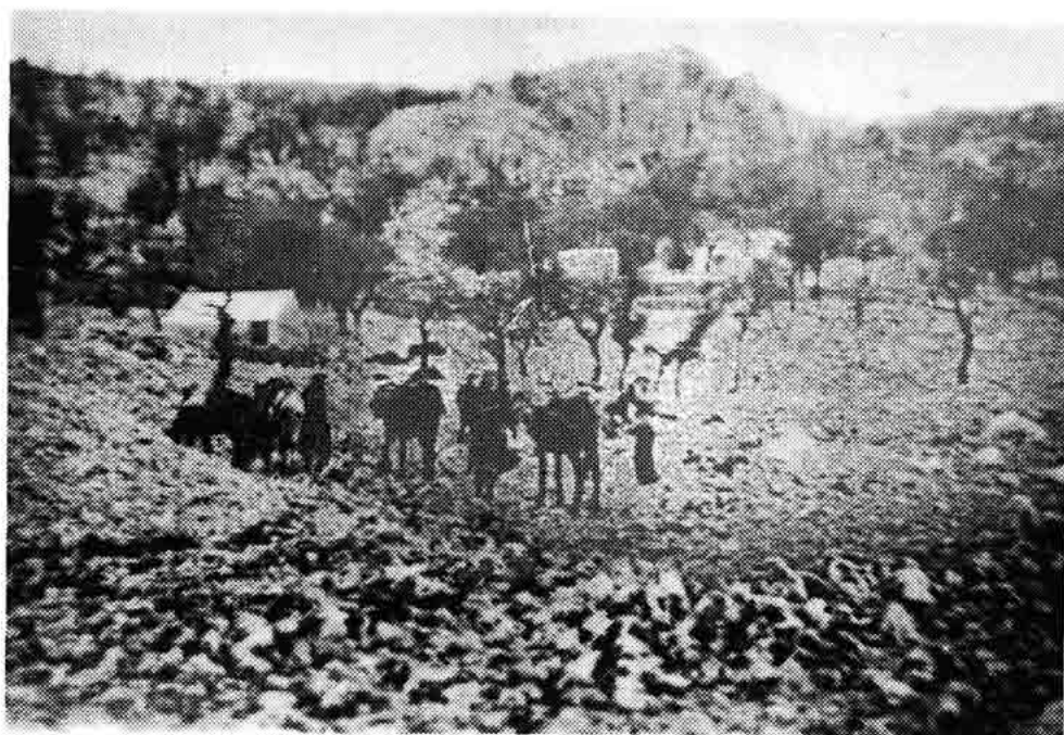
Sl. 99 — Žene Podgorja nesebično pomažu NOP, prijenos preko Velebita hrane i ratnog materijala, snimljeno negdje iznad G. Prizne 1944.