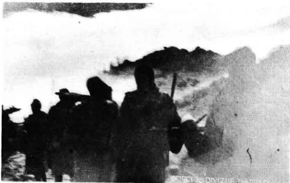
Sl. 101 — Borci 26. dalmatinske divizije u borbi za oslobođenje Senja, prelaze Vratnik, oko 8. IV 1945.

Iz svega navedenog jasno se vidi da je suradnja između Kotarskog komi-teta Partije Senj i II. pomorskog obalnog sektora — uz pomoć radio-stanice — odigrala izvanredno značajnu ulogu.