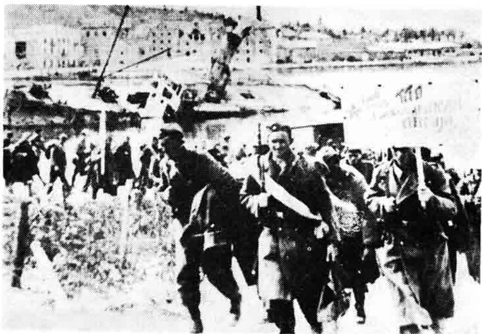
Sl. 108 — Borci 19. dalm. div. iz Senja marširaju prema Novome 9. IV 1945.

Naša XIV udarna brigada je zatim zajedno sa ostalim jedinicama XIX udarne sjevernodalmatske divizije, vodeći i dalje teške borbe, uspjela da stegne обруč oko Ilirske Bistrice, gdje se nalazila glavnina 97 njemačkog korpusa. Prema pričanju mojih ratnih drugova, 7. V 1945. godine, poslije strašne vatre iz svih topava i minobacača, koja je traja čitav sat — sve jedinice XIX udarne divizije su krenule u posljednji napad na opkoljene snage 97 njemačkog korpusa. Već u 06,00 sati ujutro Nijemci su kapitulirali. Njihova komanda je bila prisiljena da pristane na безусловnu kapitulaciju. Ukupno se predalo 16.000 njemačkih vojnika, oficira i nekoliko generala. U naše ruke je pao ogroman ratni plijen. Ovim je prestao otpor neprijatelja u Istri i Slovenskom primorju. Time je ujedno bio i kraj dugih, teških i slavnih borbi jedinica naše XIX sjevernodalmatinske udarne divizije na njenom odlučnom putu u borbi za slobodu naše zemlje. Jedinice XIX divizije su časno izvršile svoj zadatak.