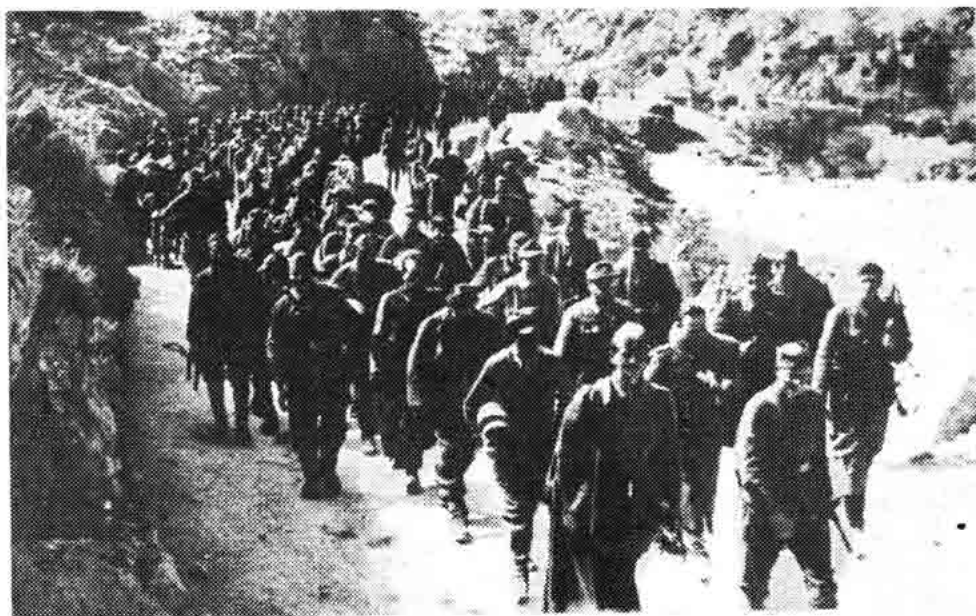
Sl. 127 — Partizani sprovode kolonu zarobljenih njemačkih vojnika, senjskom Dragom u Liku, travanj 1945.