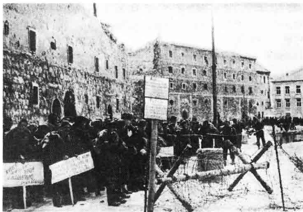
Sl. 126 — Borci 26. dalm. div. pred ukrcaj na brodove za desant, senjska luka travnja 1945.