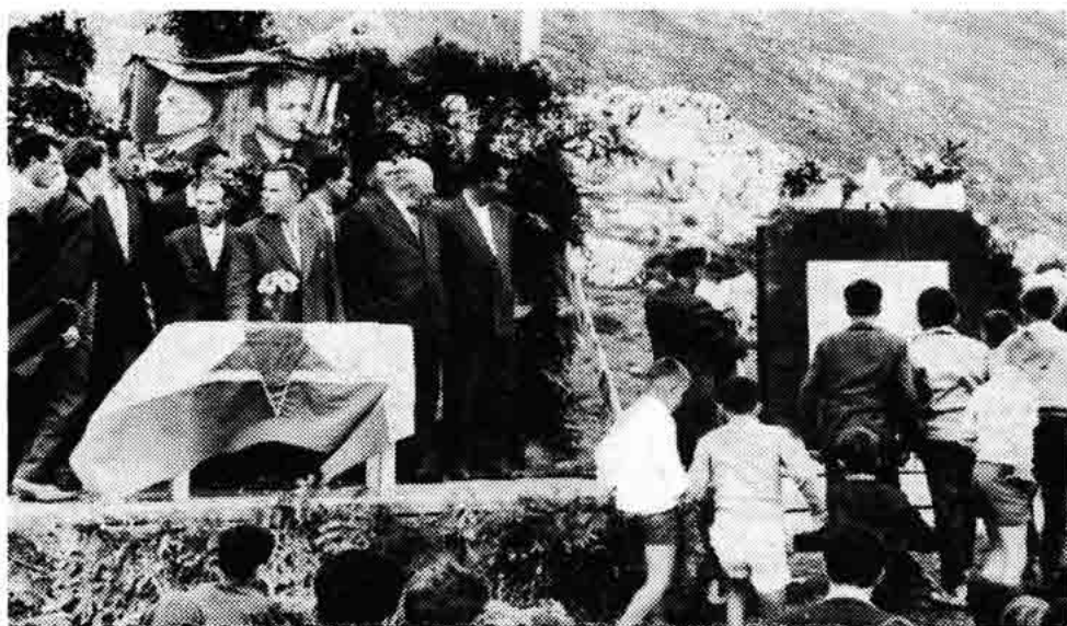
Sl. 123 — Otkriće spomenika Revolucije na mjestu »Vrtlina«, s lijeve strane ceste Alan—Krivi Put 1960.