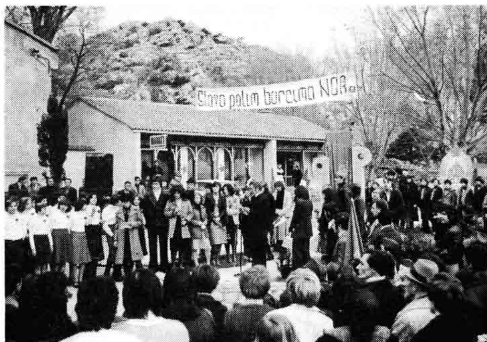
Sl. 124 — Otkriće spomenika palih boraca NOR-a u Jurjevu, na obali 1975.