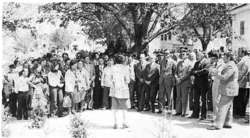
Sl. 119 — Otkriće spomen-ploče na kući Frulić (1977.), gdje su bile društvene prostorije part. org. Jurjeva 1919/1920.