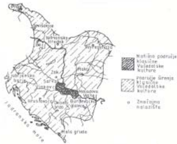
Slika 1. Karta rasprostranjenosti vučedolske kulture Figure 1. The map of distribution of the Culture of Vučedol

To je neka vrsta nove "protoindustrijske revolucije" u Europi jer se dio populacije bogata stočarskog društva opredjeljuje za još prosperitetnije zanimanje - metalurgiju. Posvetivši se preradbi rudače i serijskoj (normiranoj) proizvodnji metala, unijeli su u metalurgiju bakrenog i brončanog doba sve značajne inovacije (kupolaste peći, dvodijelne i višedijelne glinene kalupe, miših. legiranje itd.).