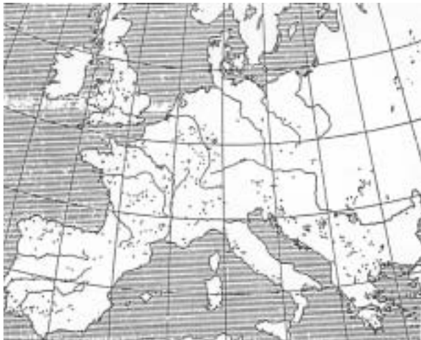
Slika 2. Položaj rudnika u Europi u doba Rimskog Carstva Figure 2. Location of mines in Europe during the Rome Empire

U doba cara Galijena u Sisciji je otvorena kovnica novca. Poslije su rimski metalurzi posegnuli za ljubijskim rudnicima željeza i tada se otvara put riječnim tokovima Japre - Sane - Une - Save - Kupe. U okolici Siscije, kao velikog metalur-