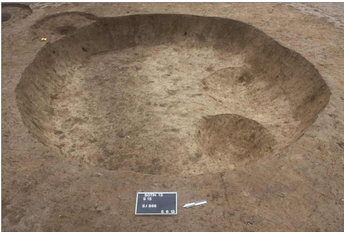
Sl. 6 Jama SJ 866