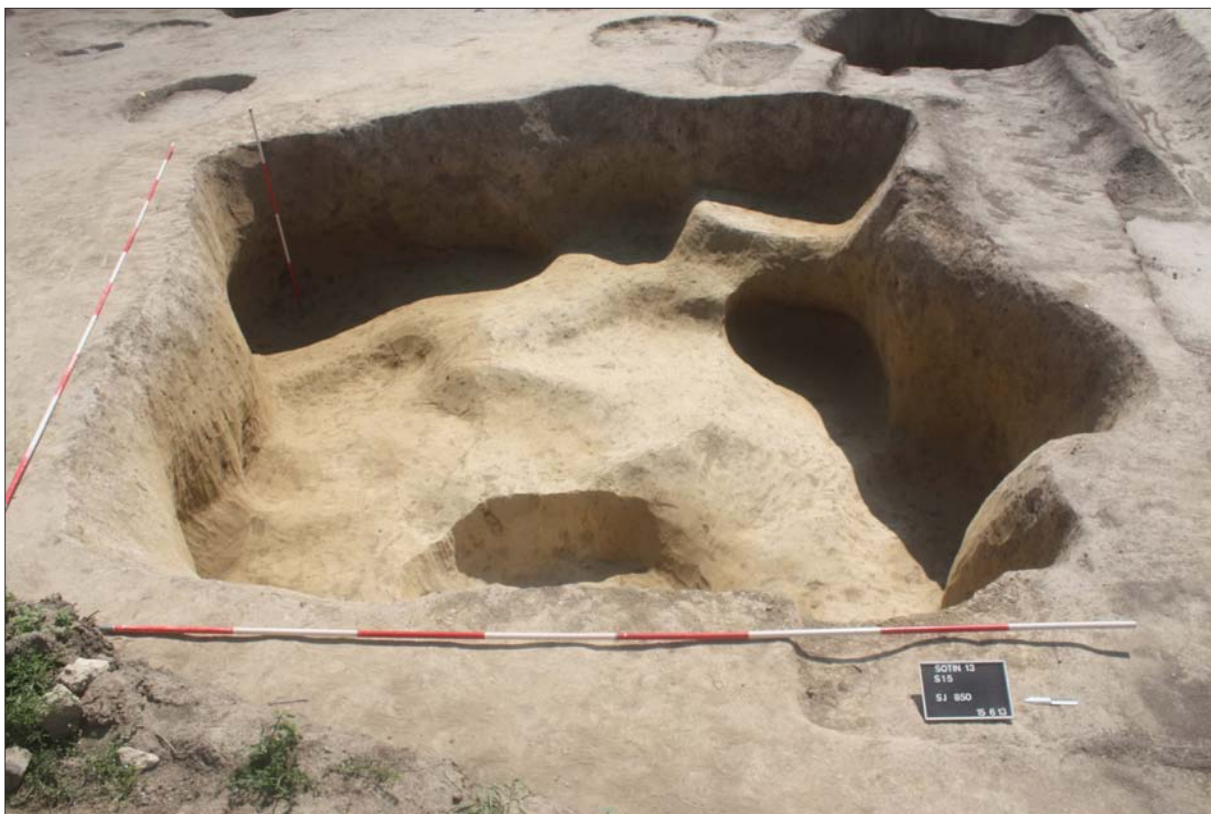
Sl. 1 Zemunica SJ 850