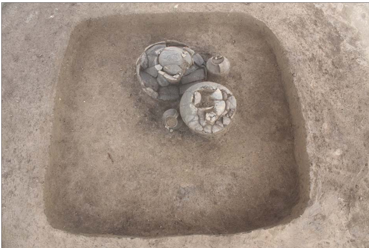
Sl. 3 Grob 94