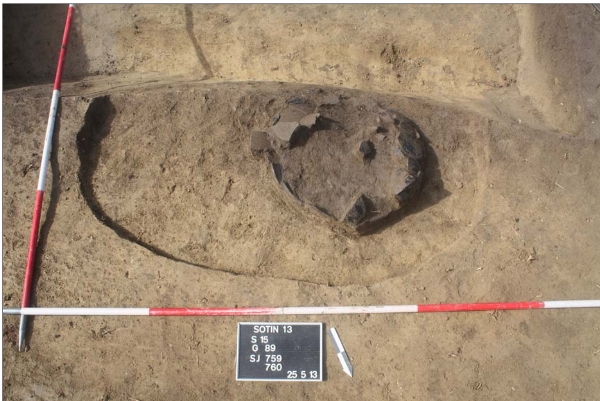
Sl. 2 Grob 89 presječen kanalom SJ 608