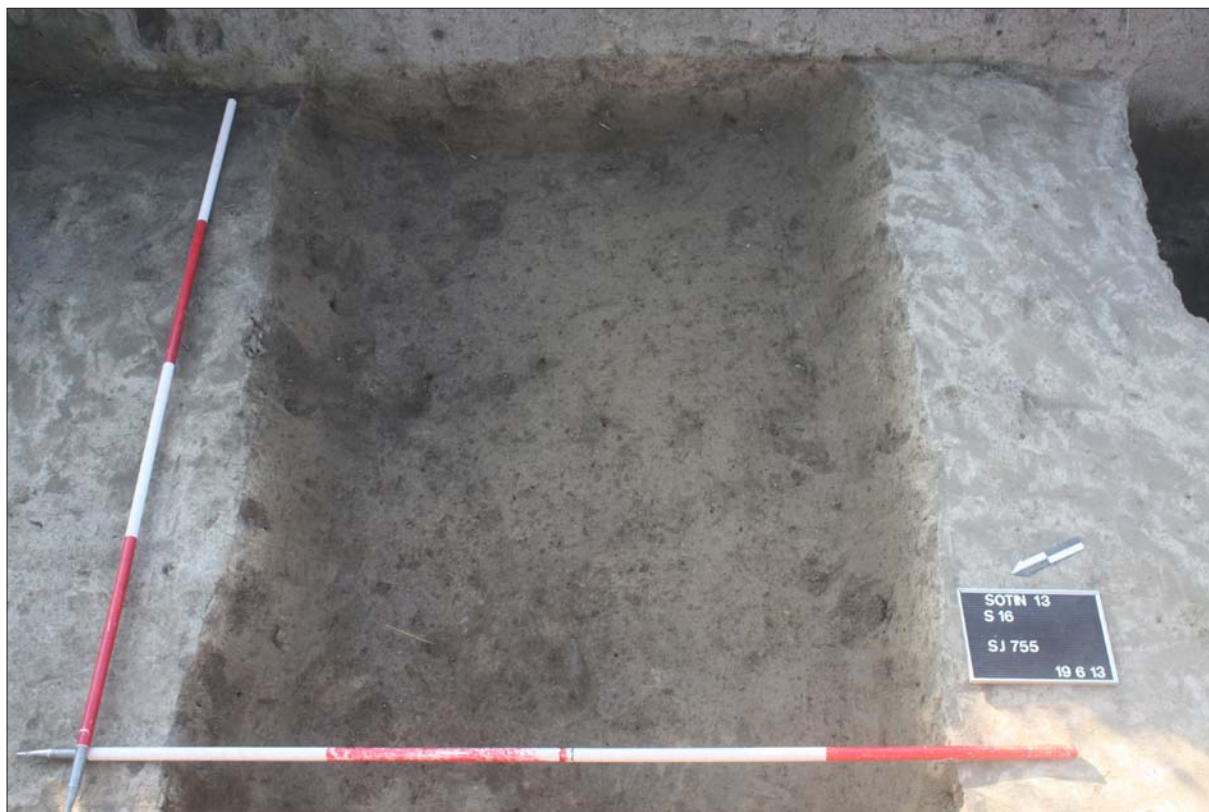
Sl. 4 Kanal SJ 755 u sondi 16