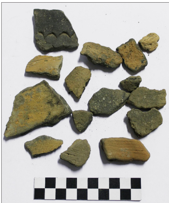
Sl. 6 Ulomci keramike iz SJ 52

Fig. 6 Potsherds from SU 52