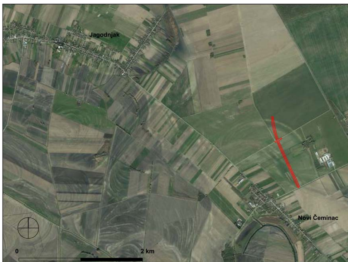
Sl. 1 Položaj nalazišta AN 9 Novi Čeminac – Remanec poljana – Krčevine (obradila: K. Jelincić Vučković)

Ključne riječi: Baranja, Novi Čeminac, autocesta A5, brončanodobno naselje, Szeremle kultura Key words: Baranja, Novi Čeminac, A5 motorway, Bronze Age settlement, Szeremle culture