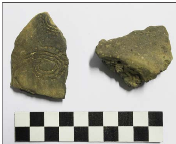
Sl. 7 Ulomci keramike Dalj – Bijelo Brdo, odnosno Szeremle kulturne grupe iz SJ 15

Fig. 7 Potsherds of the Dalj – Bijelo Brdo, that is, Szeremle culture from SU 15