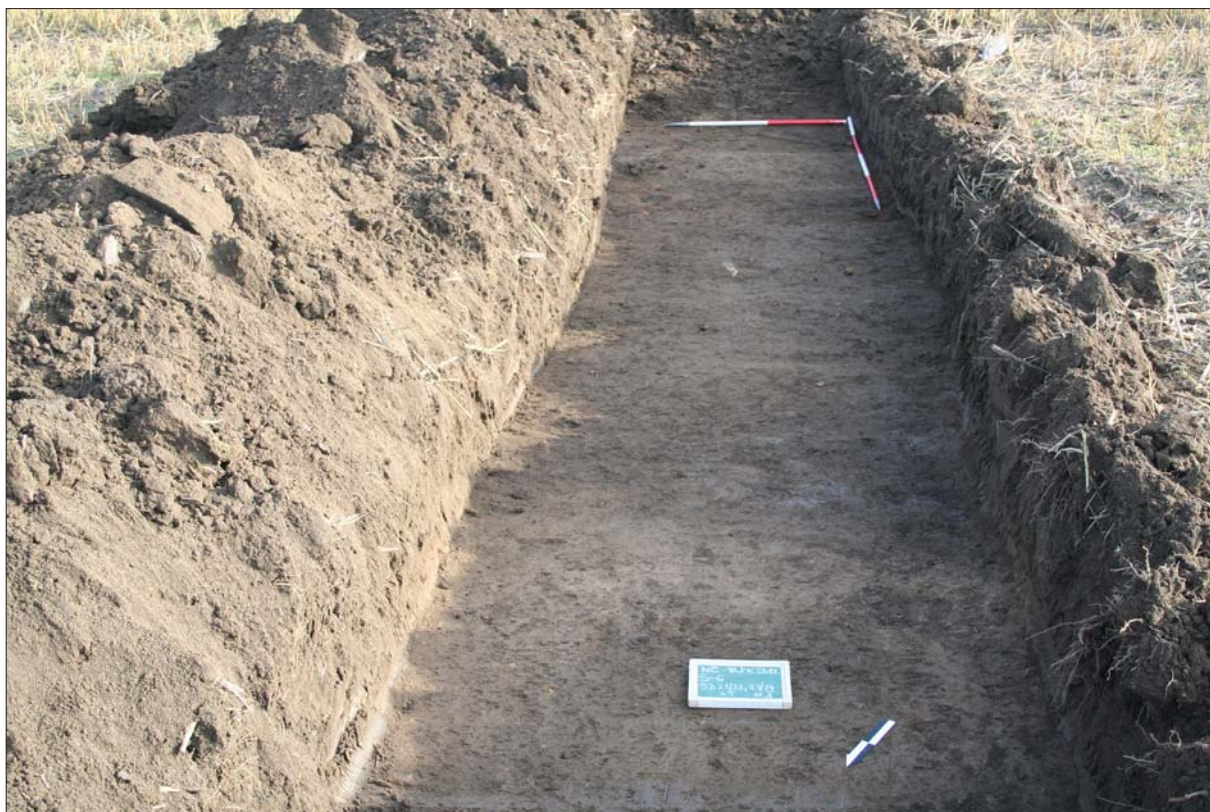
Sl. 3 Sloj SJ 25 te objekti SJ 21/22 i 23/24

Fig. 3 Layer SU 25 and structures SU 21/22 and 23/24