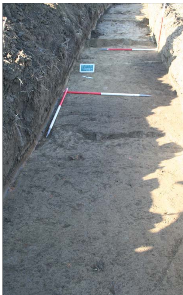
Sl. 4 Sloj SJ 56 i objekti SJ 52/53 i 54/55

Fig. 4 Layer SU 56 and structures SU 52/53 and 54/55