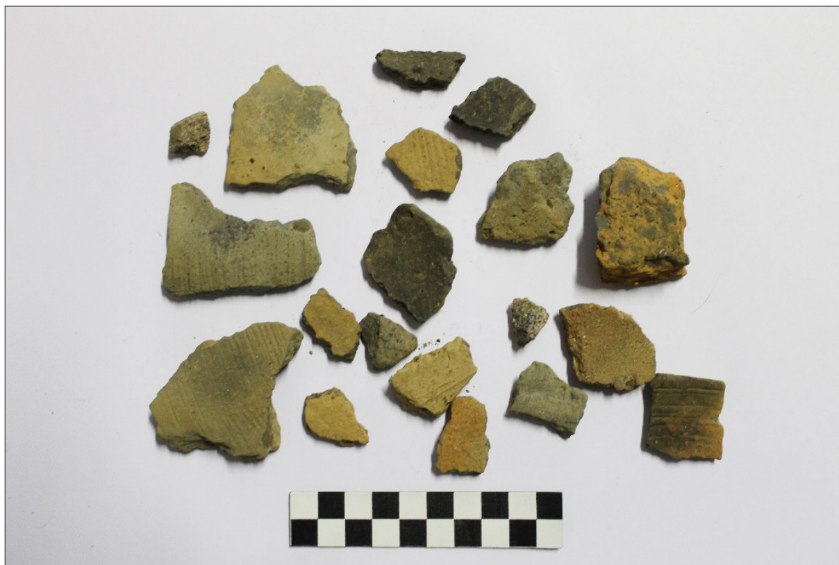
Sl. 5 Ulomci keramike iz SJ 21

U probnim istraživanjima lokaliteta AN 9 Novi Čeminac – Remanec poljana – Krčevine na trasi autoceste AN 5 ustanovljeno je postojanje većega brončanodobnog naselja. Na osnovi gustoće rasprostiranja arheoloških objekata može se pretpostaviti da je centar naselja bio smješten u južnom dijelu lokaliteta na najvišem dijelu prirodne grede koja se pruža od sjeverozapada prema jugoistoku. Buduća istraživanja ovog lokaliteta pružit će vrijedne nove spoznaje o naseljenosti i funkcioniranju ovog prostora tijekom brončanog doba.