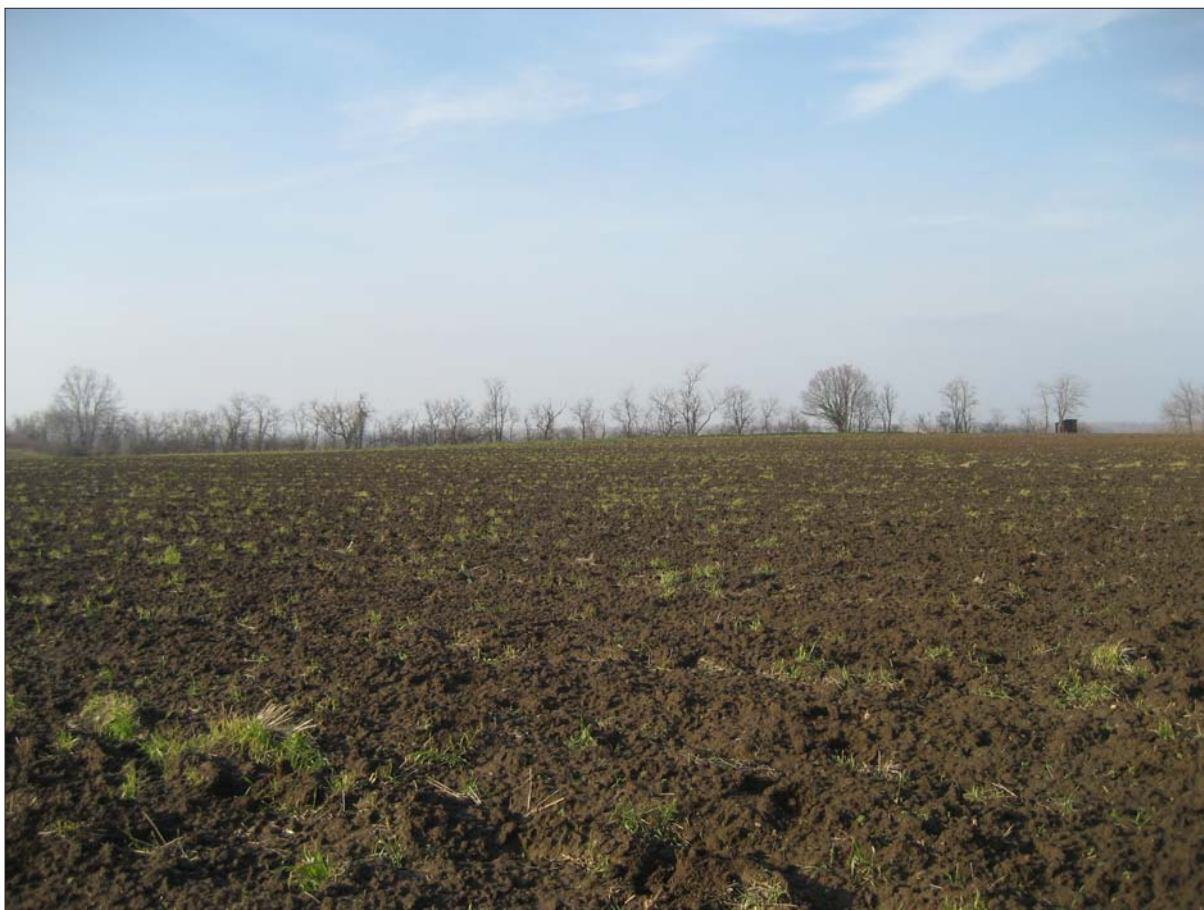
Sl. 3 Položaj Opatovac Tršćanik istok