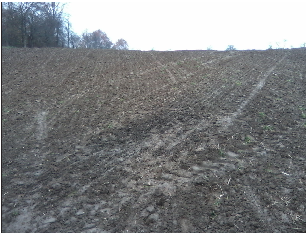
Sl. 4 Donja Motičina – Gajić, Selište

ma jugoistoku. U dnu oranice uočena je tamna promjena na zemlji (sloj gareži), dimenzija oko 3x1 m, na čijoj je površini prikupljena veća količina grube kasnosrednjovjekovne keramike (14.–15. stoljeće). Riječ je o ulomcima pretežno sive, crne, smeđe i crvenkaste boje, među kojima se izdvaja velik broj rubova oštre profilacije. Zanimljiv nalaz predstavlja rub plitice ukrašene s unutarnje strane plitko žlijebljenom jednostrukom valovnicom. Ostali ulomci ukrašeni su žlijebljenom jednostrukom valovnicom, žlijebljenim horizontalnim linijama te žigosanim kvadratičima izvedenim kotačićem. Zanimljivo je za istaknuti da se čitav predio uz šumu Hrastovac u narodu naziva Selište, što upućuje na postojanje starijeg naselja. Njegove bi ostatke mogli predstavljati i nalazi pronađeni na ovome lokalitetu.