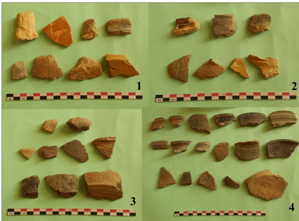
Sl. 5 Nalazi s lokaliteta: 1 Donja Motičina – Motičina doljna; 2 Donja Motičina – Brdo; 3 Donja Motičina – vrt zapadno uz crkvu Svih svetih; 4 Donja Motičina – Gajić, Selište