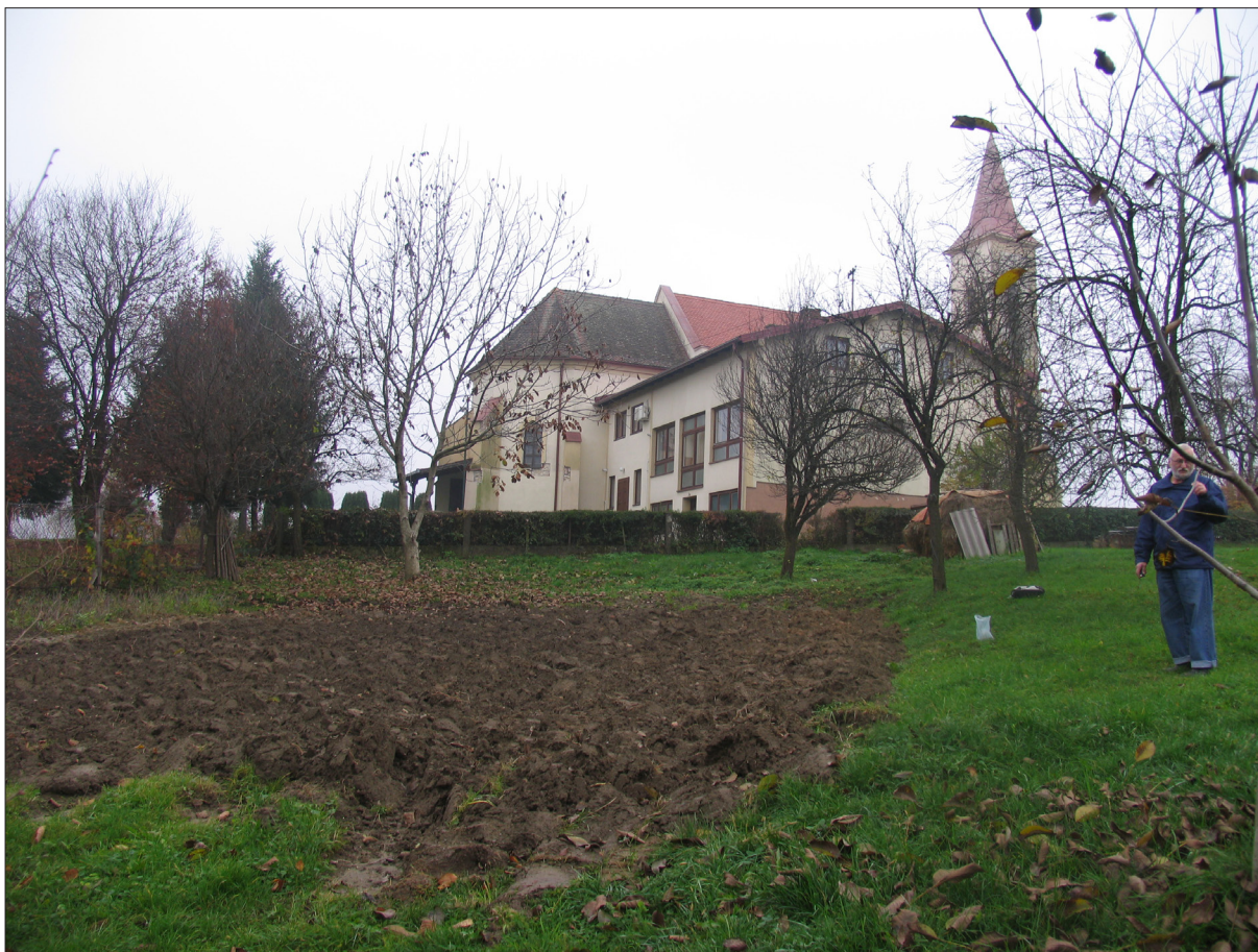
Sl. 1 Donja Motičina – vrt zapadno uz crkvu Svih svetih