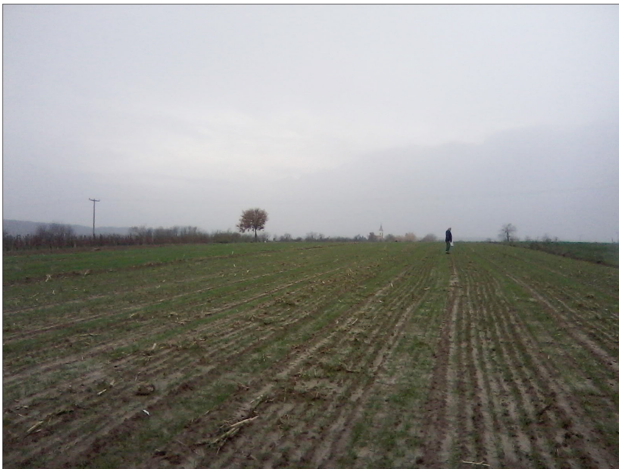
Sl. 3 Donja Motičina – Brdo