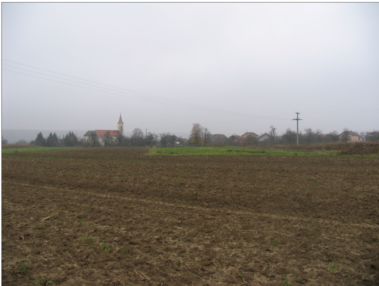
Sl. 2 Donja Motičina – Motičina doljna