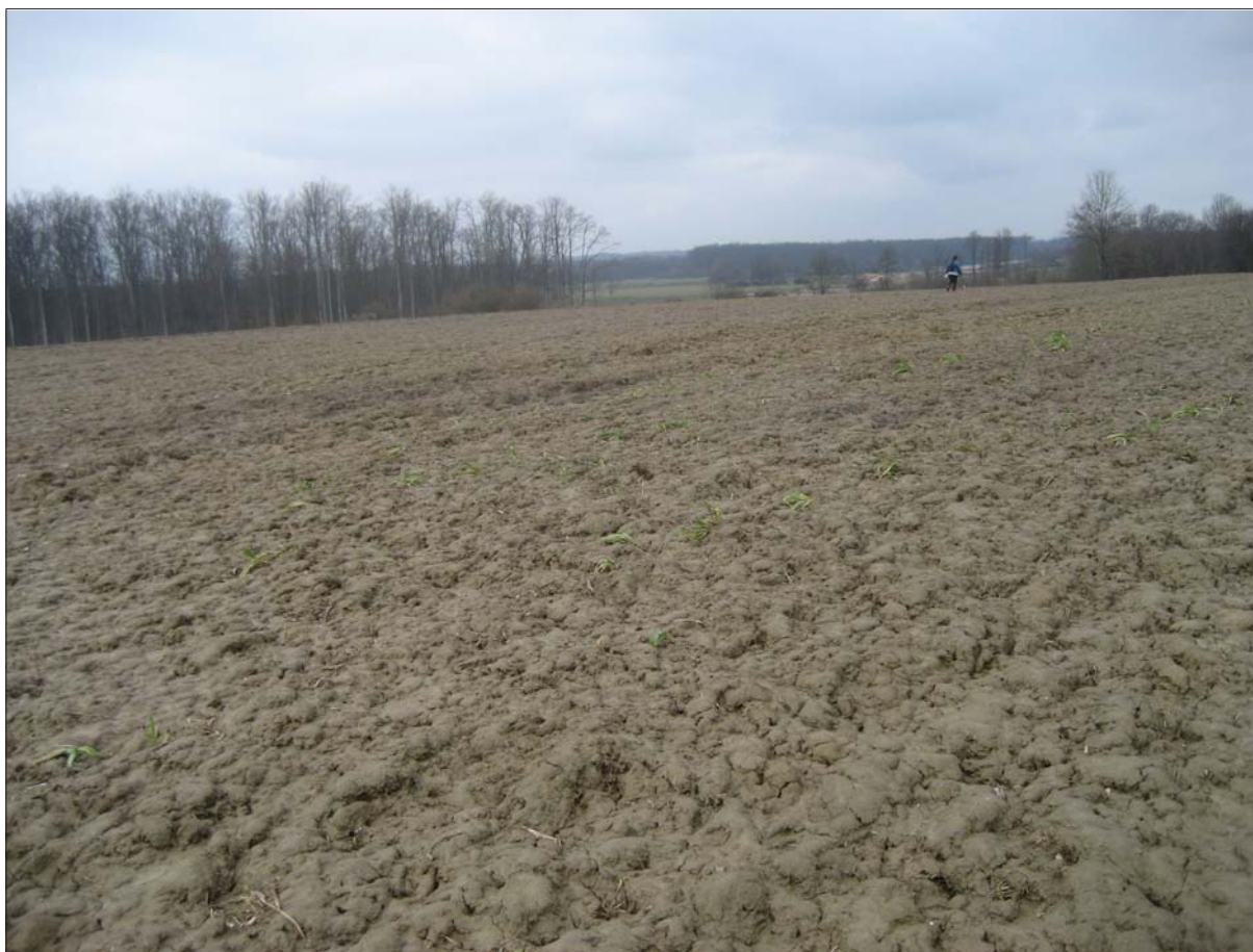
Sl. 3 Izorane jame na lokalitetu Buzadovec – Donje brdarine 1