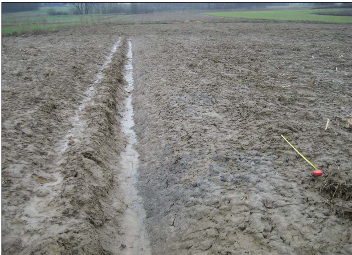
Sl. 4 Izorana kasnosrednjovjekovna jama na lokalitetu Tučenik – Poljice

Fig. 4 A ploughed late medieval pit at the Tučenik – Poljice site