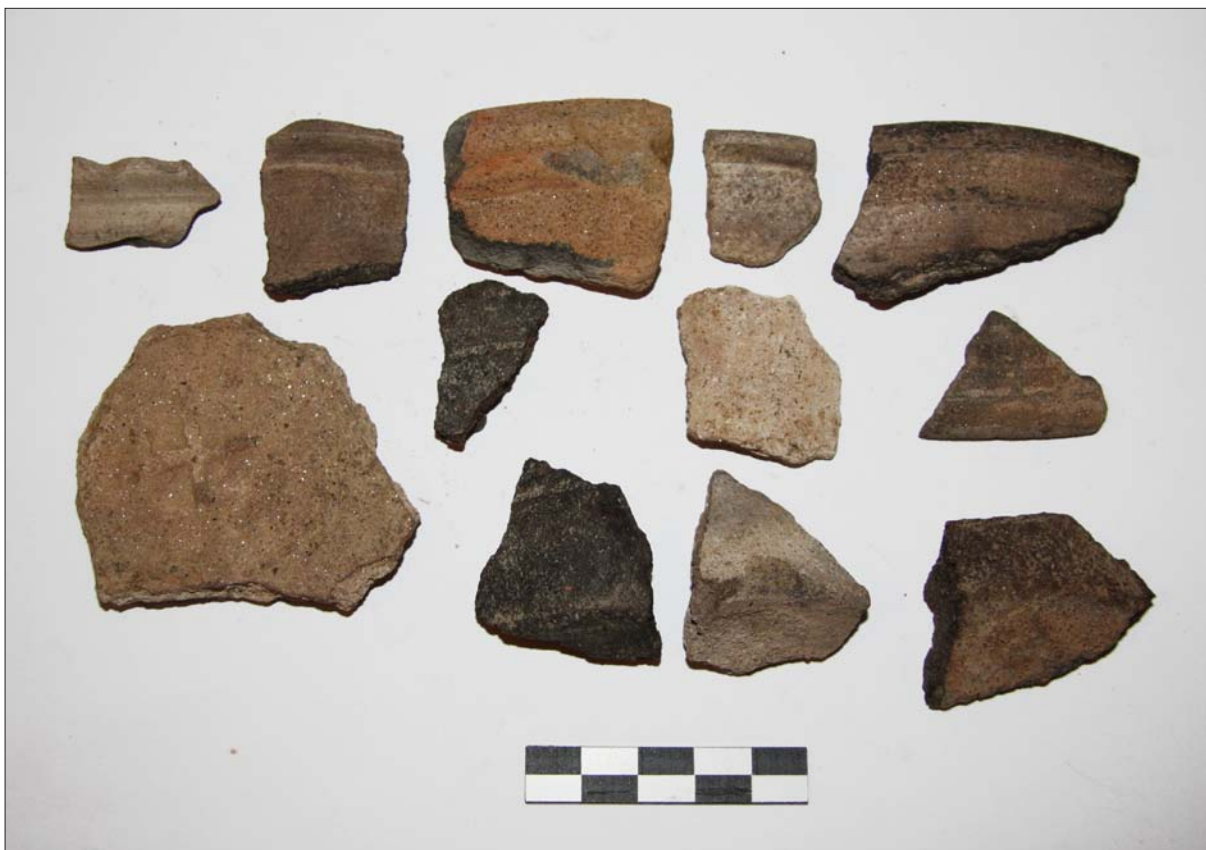
Sl. 11 Ulomci kasnosrednjovjekovne keramike s lokaliteta Poljana Križevačka – Vrbik Fig. 11 Fragments of late medieval pottery from Poljana Križevačka – Vrbik