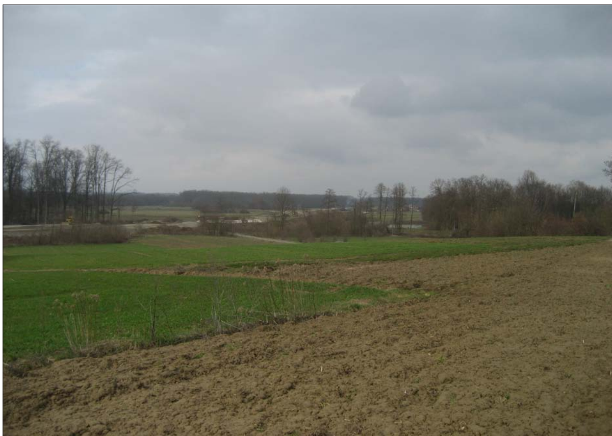
Sl. 2 Pogled prema Glogovnici i trasi autoceste AN 12 u izgradnji s položaja Buzadovec-Donje brdarine 1