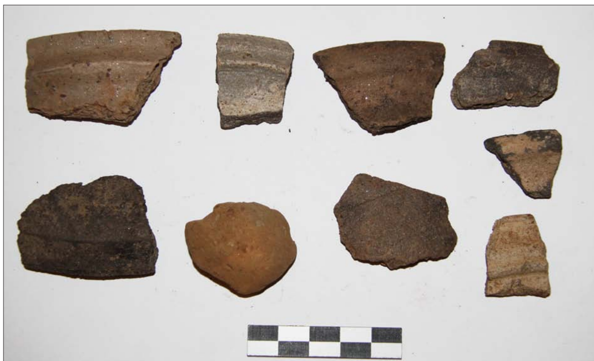
Sl. 8 Ulomci kasnosrednjovjekovne keramike s lokaliteta Buzadovec – Donje brdarine 1

Fig. 8 Fragments of late mediaeval pottery from Buzadovec – Donje brdarine 1