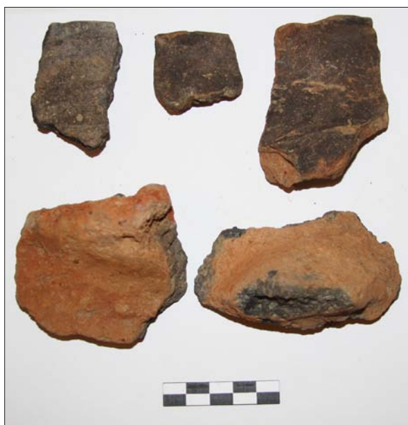
Sl. 9 Ulomci kasnobrončanodobne keramike iz izorane jame na lokalitetu Poljana Križevačka – Donje polje 4

Fig. 8 Fragments of late mediaeval pottery from Buzadovec – Donje brdarine 1