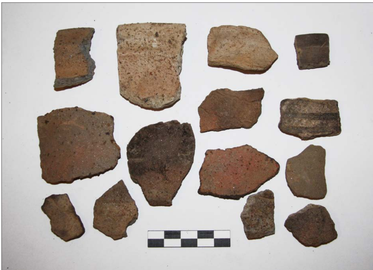
Sl. 10 Ulomci kasnosrednjovjekovne i novovjekovne keramike s lokaliteta Poljana Križevačka – Donje polje 4 Fig. 10 Fragments of late medieval and early modern period pottery from Poljana Križevačka – Donje polje 4