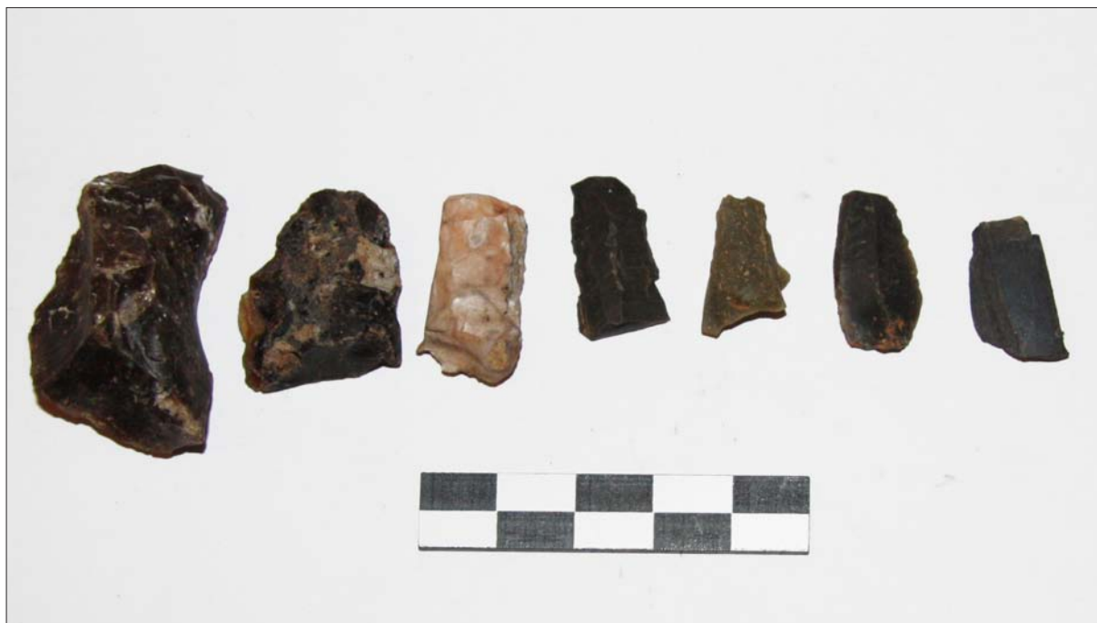
Sl. 7 Mikroliti s lokaliteta Buzadovec – Donje brdarine 1

Ukratko možemo sumirati da je na rekognosciranom području šire okolice triju arheološki istraživanih lokaliteta AN 3 Buzadovec – Vojvodice, AN 4 Poljana Križevačka 1 i AN 5 Poljana Križevačka 2 s ustanovljenim ostacima naselja iz razdoblja bakrenog, ranoga brončanog, kasnoga brončanog i mlađega željeznog doba te kasnoga srednjeg vijeka, dakle na području površine oko 5 km 2 , ustanovljeno još 28 položaja s površinskim arheološkim nalazima i to uglavnom upravo iz gore navedenih razdoblja (T. 1). Kasnosrednjovjekovni nalazi pronađeni su na 25 položaja. Na mnogima od njih prepoznat je kontinuitet života i u novom vijeku. Tek je na dva položaja ustanovljeno naseljavanje početkom ranoga novog vijeka. Samo na tri položaja ustanovljeno je naseljavanje u antici. Na 16 položaja ustanovljen