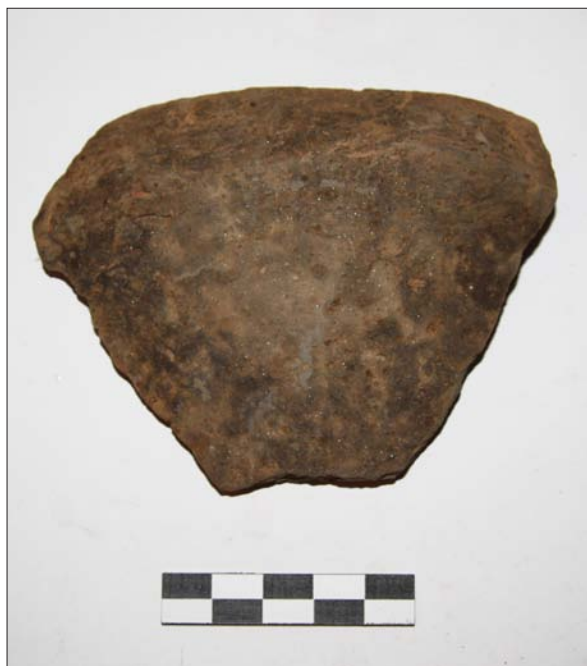
Sl. 6 Ulomak lasinjske kulture s lokaliteta Buzadovec – Donje brdarine 1