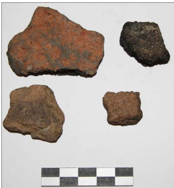
Sl. 12 Ulomci brončanodobne keramike s lokaliteta Cubinec – Male livade