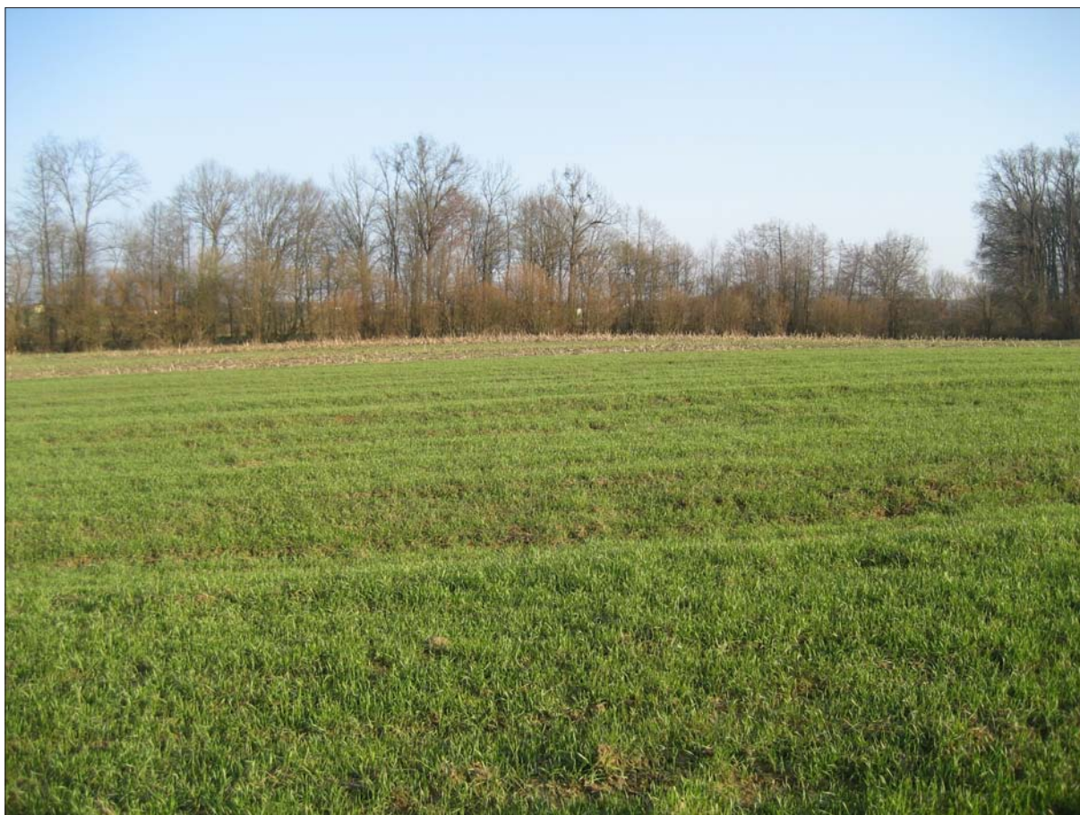
Sl. 5 Lokalitet Poljana Križevačka – Vrbik uz Glogovnicu

Fig. 4 A ploughed late medieval pit at the Tučenik – Poljice site