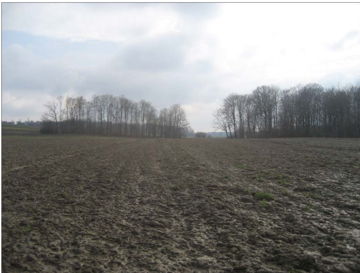
Sl. 1 Položaj Buzadovec – Donje brdarine 1