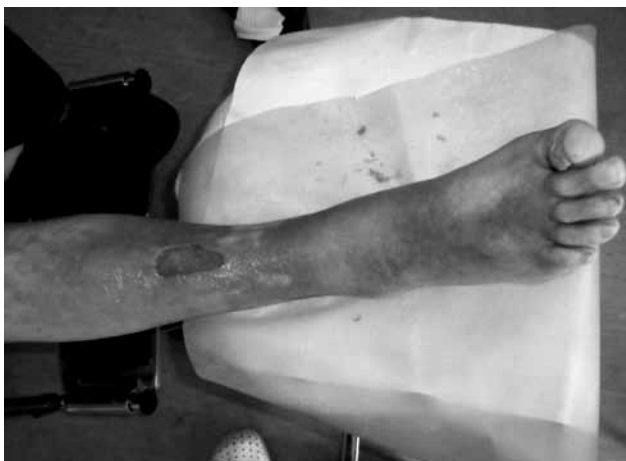
Sl. 1. Rana kod prvog dolaska bolesnika u ambulantu