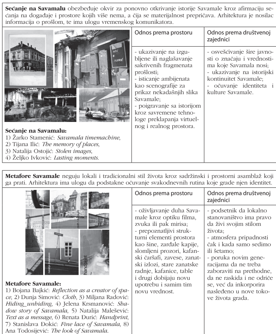
Prilog 4: Tabela rezultata studentskih radova

Bez obzira na prostorni obuhvat i karakter radova, mogu se jasno izdvojiti 4 tematska okvira koji usmeravaju reafirmaciju Savamale. To su: a) Sećanje na Savamalu, b) Metafore Savamale, c) Savamala kao igralište, i d) Savamala kao društveni pejzaž. U prikazanoj tabeli pokazano je po nekoliko predstavnika svake grupe, i to kroz odnos koji koncept gradi prema mestu, sa jedne i lokalnom stanovništvu sa druge strane, kao osnovnim vrednostima Savamale.