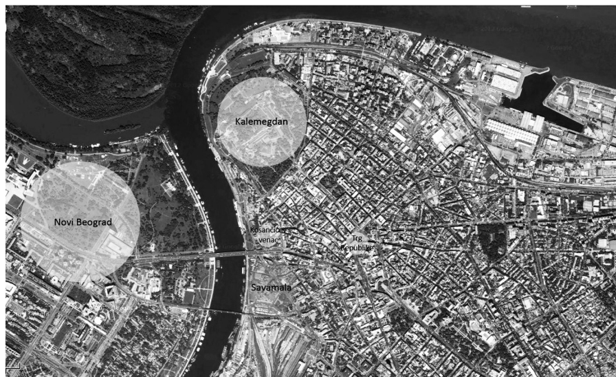
Prilog 1: Mapa užeg centra Beograda sa pozicijom Savamale

venca (oba istorijski zaštićena područja) i prostire se duž desne obale reke Save. Iako se nalazi u zoni užeg gradskog jezgra od njega je odsečena. To je deo grada koji se iz životnog pretvorio u napušteno mesto, iz politički i kulturno značajnog u marginalizovano područje, iz formalnog u neformalno, a sada i efemeran urbani ostatak ovičen gustim saobraćajem, okarakterisan društveno marginalizovanim grupama korisnika i stanovnika funkcionalno isključenim iz života grada.