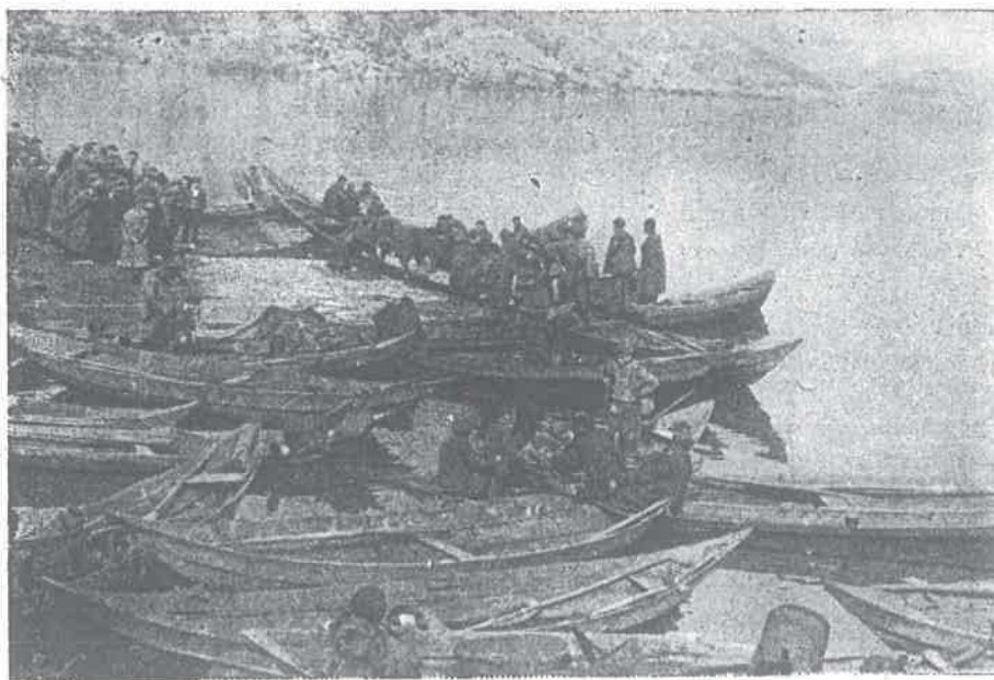
Grič je izvučen

Jezero eksploatiše jedno preduzeće za ulov i 4 ribarske radne zadruge. Naročito dobre rezul- tate u toku prošle godine postiglo je novoformi-